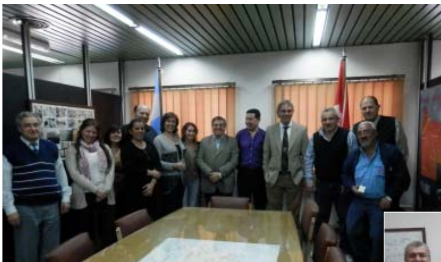
Algunos de los compañeros distinguidos, posando junto a autoridades de la EPEC y a dirigentes de nuestra organización sindical.