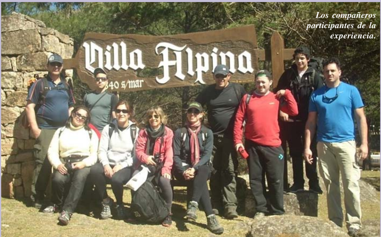
Los compañeros participantes de la experiencia.

Compañeros participaron en caminata hasta el Champaquí