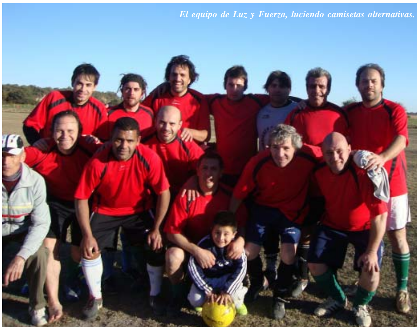
El equipo de Luz y Fuerza, luciendo camisetas alternativas.