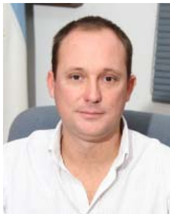
Cro. Juan Manuel Losada, Subsecretario General.

En nuestro caso, el riesgo originado por la energía eléctrica es altamente peligroso y puede considerarse la siguiente clasificación al tipificarse los accidentes ocurridos en este ámbito: por choque eléctrico a partir de entrar accidentalmente en contacto con elementos con tensión; por quemaduras ante choques eléctricos o por arco eléctrico; por caídas o golpes como consecuencias de choque o arco eléctrico; por explosiones o incendios originados por la electricidad, etc. Según acuerdan los especialistas, dentro de los principales factores que influyen en el riesgo eléctrico se encuentran la intensidad de la corriente, la duración del contacto eléctrico, la impedancia (que depende de la humedad, la superficie de contacto, la magnitud y la frecuencia de dicha tensión), la tensión aplicada, la frecuencia de la corriente eléctrica y la