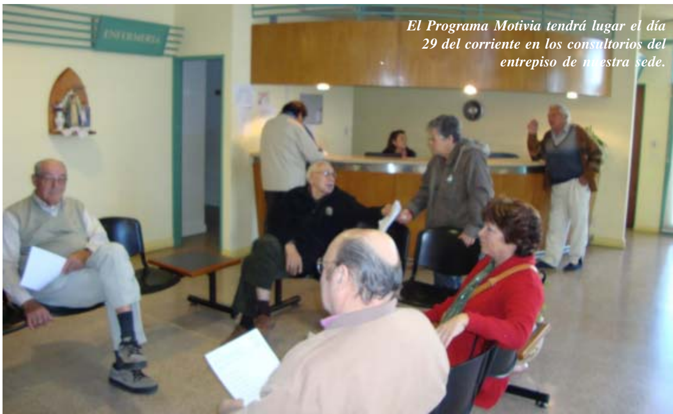
El Programa Motivia tendrá lugar el día 29 del corriente en los consultorios del entresuelo de nuestra sede.

tuvieron como resultado exceso de riesgo (Framingham mayor a 6 puntos) para tener enfermedad coronaria, hipertensión arterial y enfermedad cerebrovascular producto de hábitos de vida no saludables, como colesterol alto, sobrepeso y obesidad, diabetes, vida sedentaria y estrés y