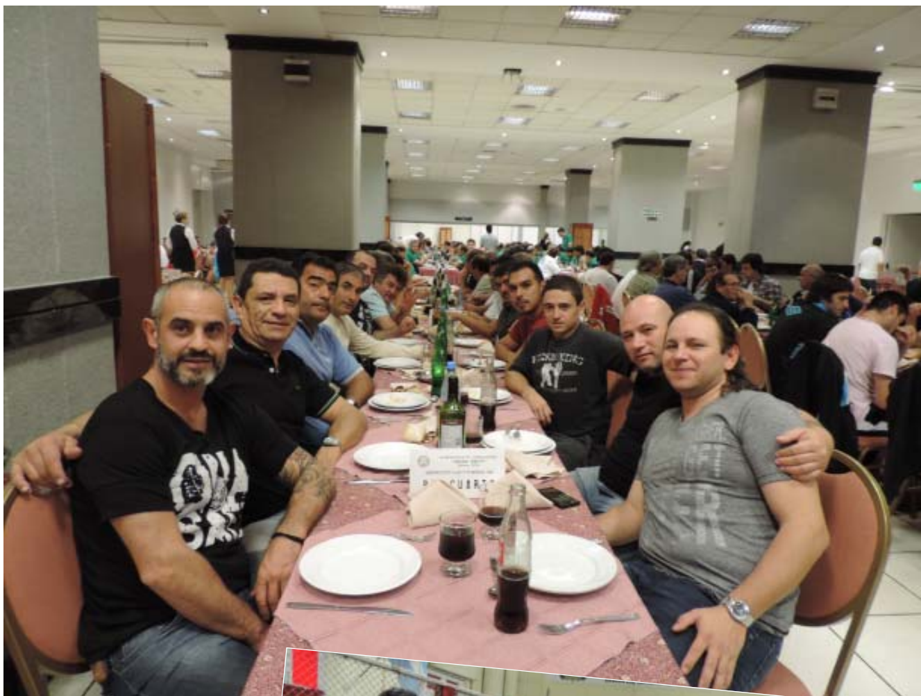
Integrantes de la delegación que representó a Luz y Fuerza de Río Cuarto en el Campeonato «Oscar Smith».

Es de destacar que predominó en todo momento la fraternidad y la camaradería, como es habitual en los encuentros finales del Campeonato Argentino «Oscar Smith», que anualmente se llevan a cabo entre distintas disciplinas en Mar del Plata, bajo la Coordinación de la Secretaría de Organización e Interior de la FATLYF.