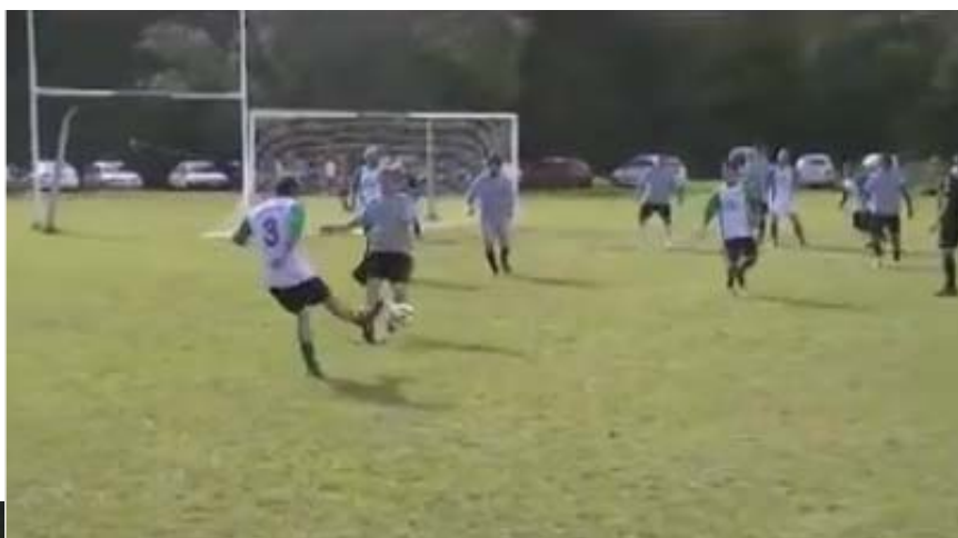
Una de las jugadas buscando el gol frente a Telefónicos.