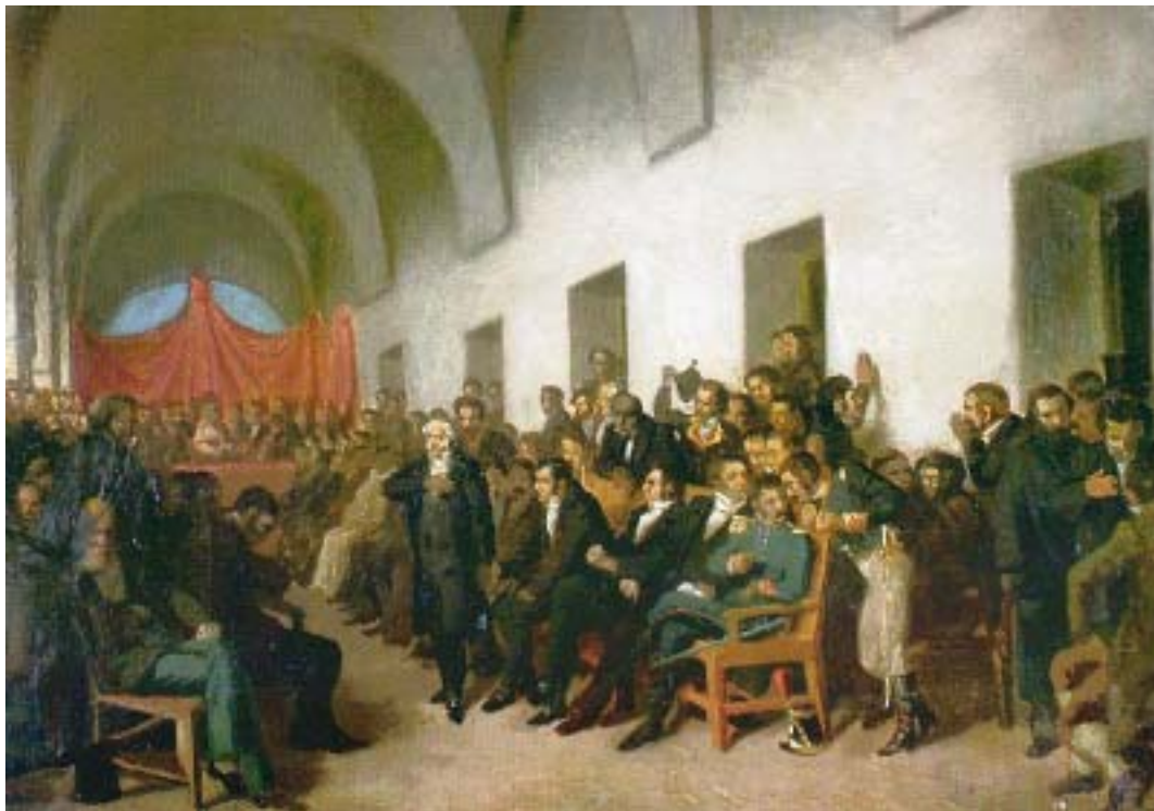
«Cabildo Abierto», cuadro de Juan Manuel Blanes (1830-1901).

Debe intervenir el Jefe del Regimiento de Patricios, Cornelio Saavedra, quien logra calmarlos garantizándoles el apoyo militar a sus reclamos.