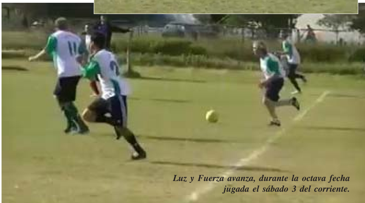
Luz y Fuerza avanza, durante la octava fecha jugada el sábado 3 del corriente.