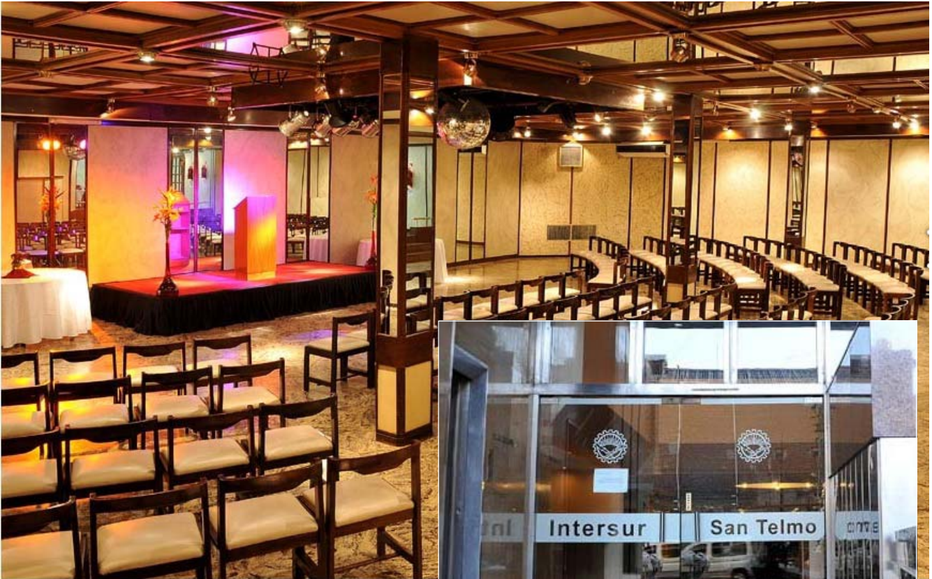
Salón de deliberaciones y fachada del hotel donde se realizará el Congreso.

La Federación Argentina de Trabajadores de Luz y Fuerza ha resuelto convocar al XL Congreso Nacional de Jubilados, cuyas deliberaciones tendrán lugar en nuestro Hotel «Intersur San Telmo», en la Ciudad Autónoma de Buenos Aires, entre los días 26 y 28 de mayo.