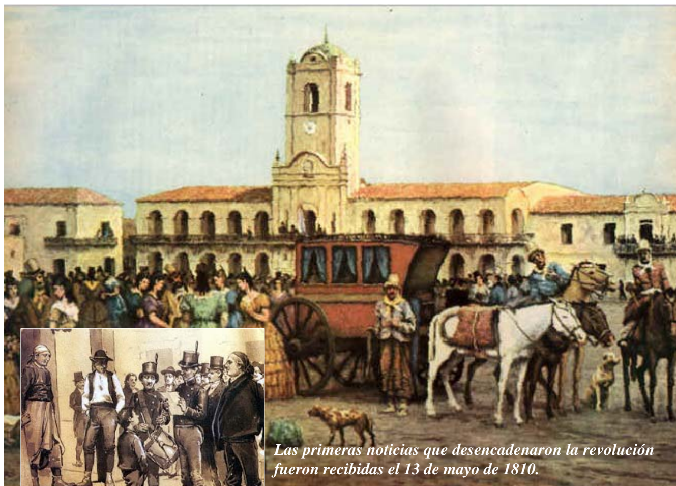
Las primeras noticias que desencadenaron la revolución fueron recibidas el 13 de mayo de 1810.

Ante la proximidad de un nuevo aniversario de la Revolución de Mayo, en esta edición comenzamos a publicar artículos que se refieren a los antecedentes que derivaron en este acto revolucionario. El presente material es publicado en el sitio www.elhistoriador.com.ar .