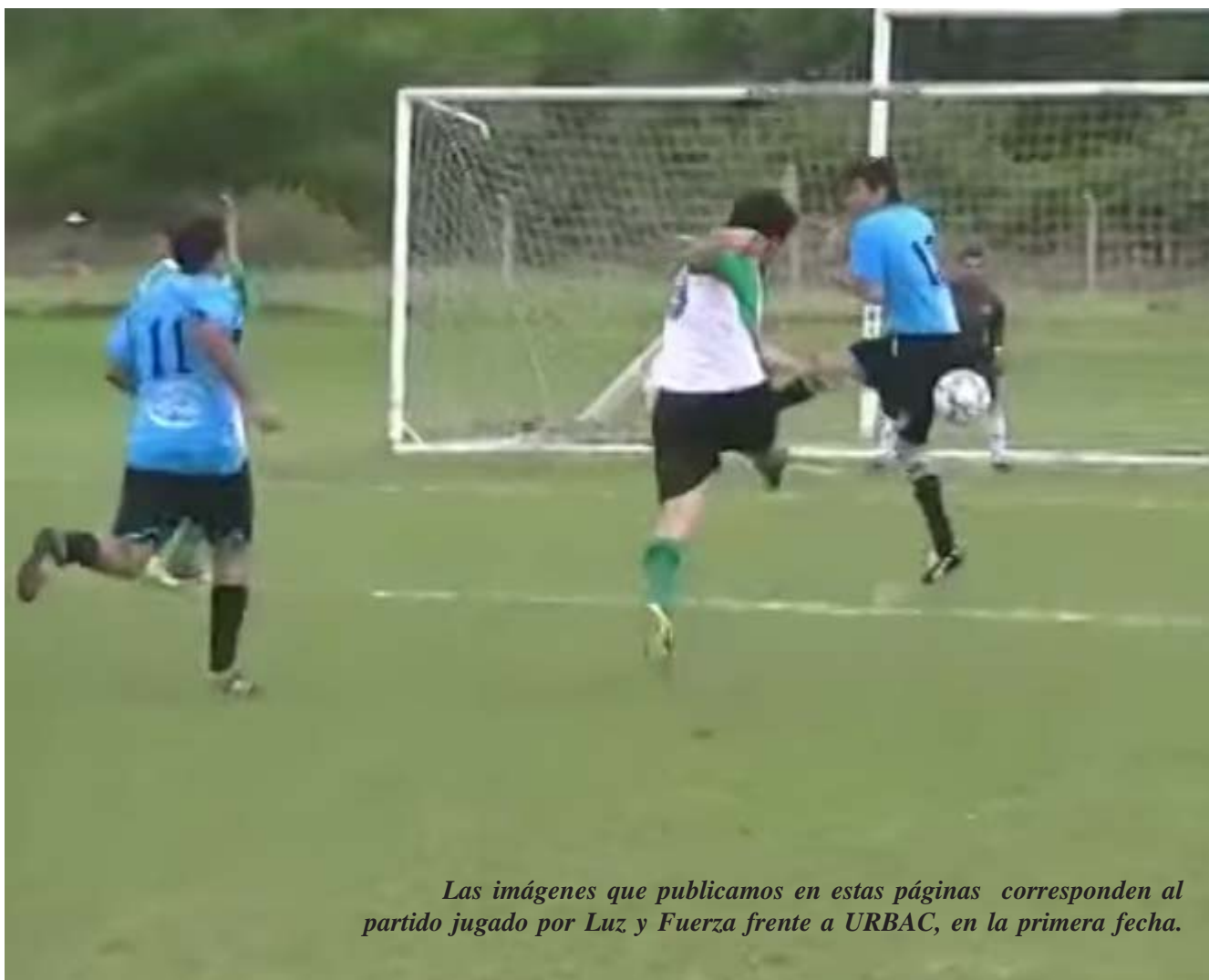
Las imágenes que publicamos en estas páginas corresponden al partido jugado por Luz y Fuerza frente a URBAC, en la primera fecha.