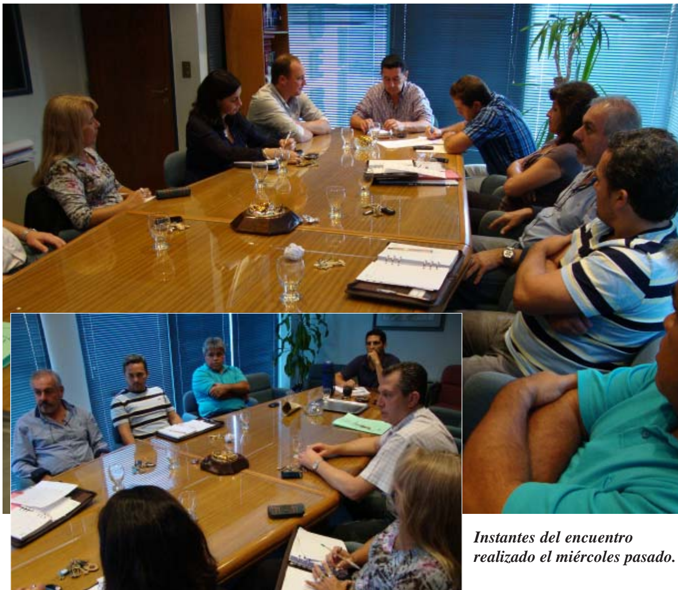
Instantes del encuentro realizado el miércoles pasado.

En el transcurso de una reunión realizada el miércoles pasado, en horas de la tarde, la Comisión Directiva del Sindicato de Luz y Fuerza de Río Cuarto se abocó al tratamiento de varios temas de importancia para la marcha institucional del gremio.