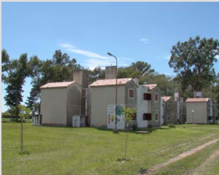
Residencias estudiantiles emplazadas en el predio de la UNRC.

La Secretaría de Organización y Asuntos Energéticos informa a los compañeros afiliados de las seccionales que se encuentra habilitado el registro de aspirantes a ocupar las residencias universitarias que posee nuestra organización en el predio de la Universidad Nacional de Río Cuarto, por lo cual los interesados deberán comunicarse a la mayor brevedad con la Secretaría mencionada.