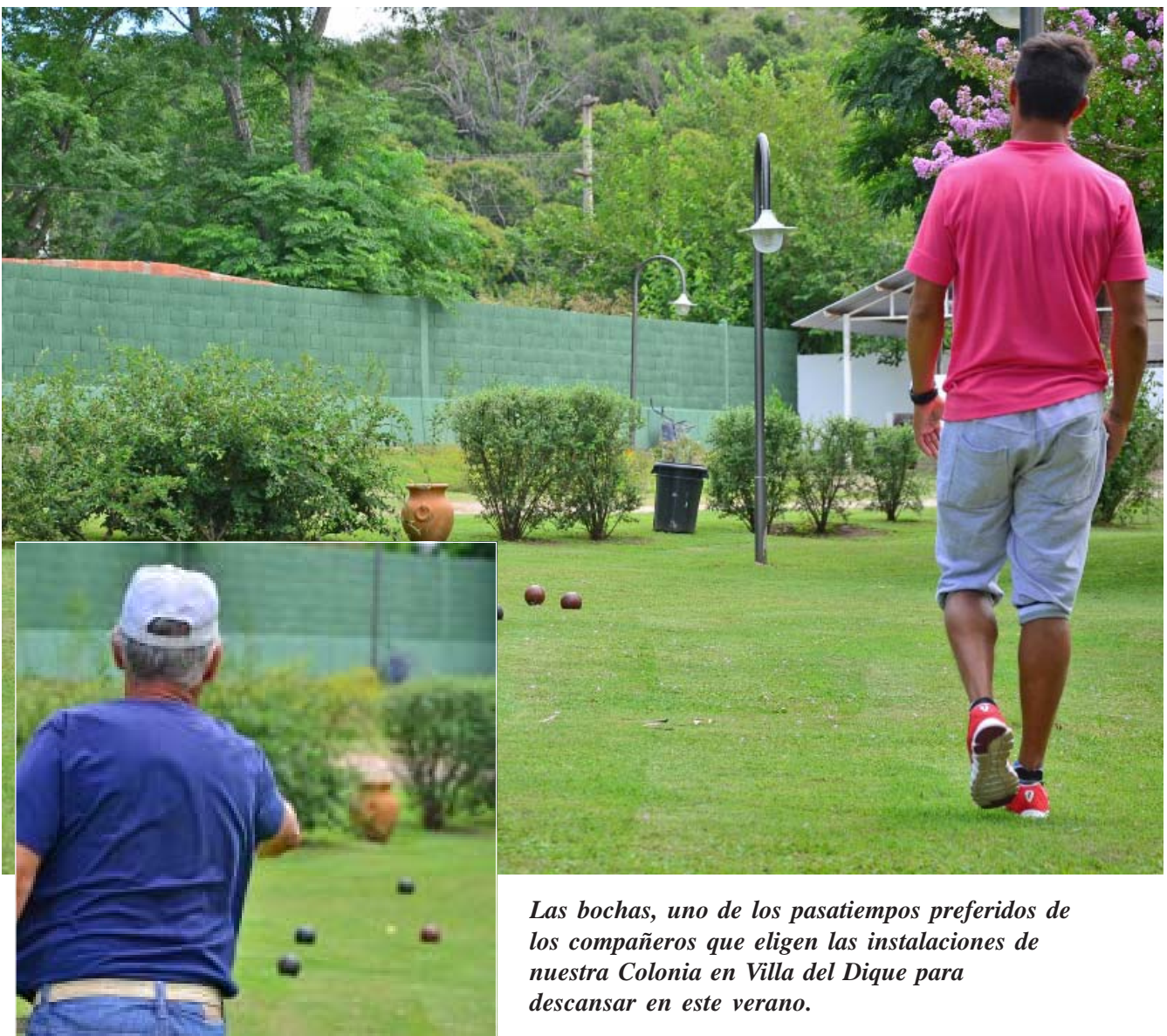
Las bochas, uno de los pasatiempos preferidos de los compañeros que eligen las instalaciones de nuestra Colonia en Villa del Dique para descansar en este verano.

Reiteramos que el pago de los montos totales por estadías de afiliados podrá hacerse hasta en seis cuotas mensuales consecutivas.