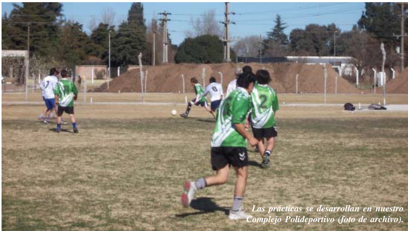
Las prácticas se desarrollan en nuestro Complejo Polideportivo (foto de archivo).

La Secretaría de Prensa, Cultura y Deportes de nuestra organización sindical recuerda a los afiliados interesados que continúan llevándose a cabo los entrenamientos en fútbol con miras a la participación en el Campeonato Argentino «Oscar Smith», que la FATALYF organiza anualmente, con la participación de equipos de numerosas organizaciones hermanas de dis-