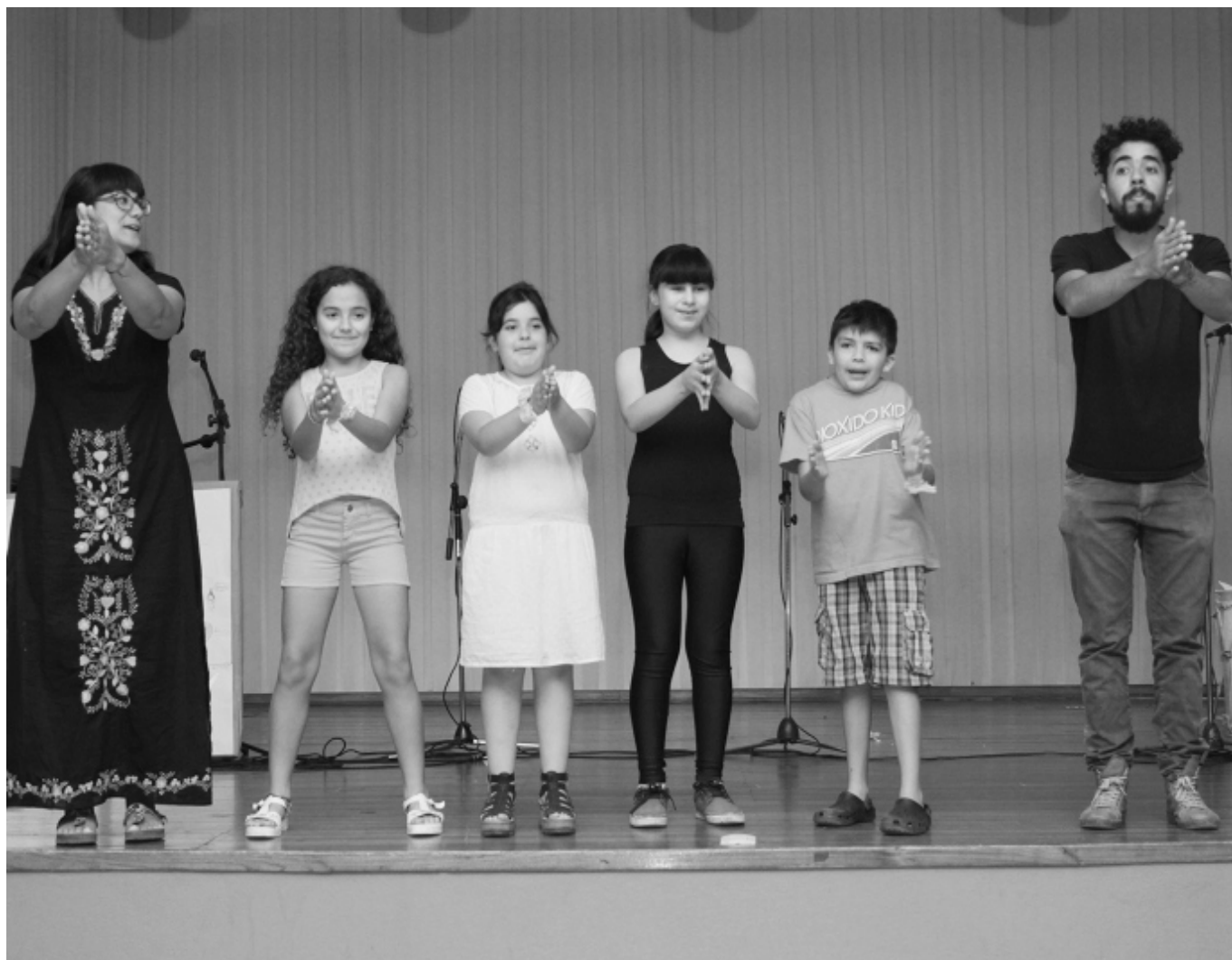
Los más chicos fueron la atracción singular de la velada realizada el martes en nuestra sede central.

Al finalizar se realizó un brindis, degustando sabores nuevos preparados por las alumnas del Taller de comida saludable, como despedida del año. ■