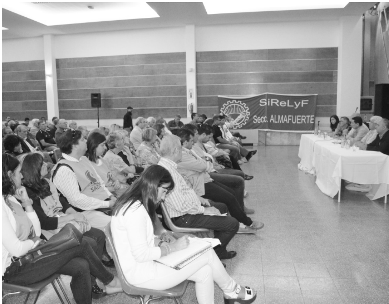
La Coordinadora de Gremios Aportantes se reunió el mes pasado en nuestra sede central.

EL LUNES PASADO, EN LA SEDE CENTRAL DE LA UNIÓN DE EDUCADORES DE LA PROVINCIA DE CÓRDOBA (UEPC), SE REUNIÓ LA COORDINADORA DE GREMIOS APORTANTES A LA CAJA DE JUBILACIONES Y PENSIONES, CON EL PROPÓSITO DE ANALIZAR LOS PASOS A SEGUIR EN LO QUE RESPECTA A LA SITUACIÓN PREVISIONAL QUE SOBREVIENE LUEGO DEL ACUERDO ALCANZADO ENTRE CÓRDOBA Y LA NACIÓN.