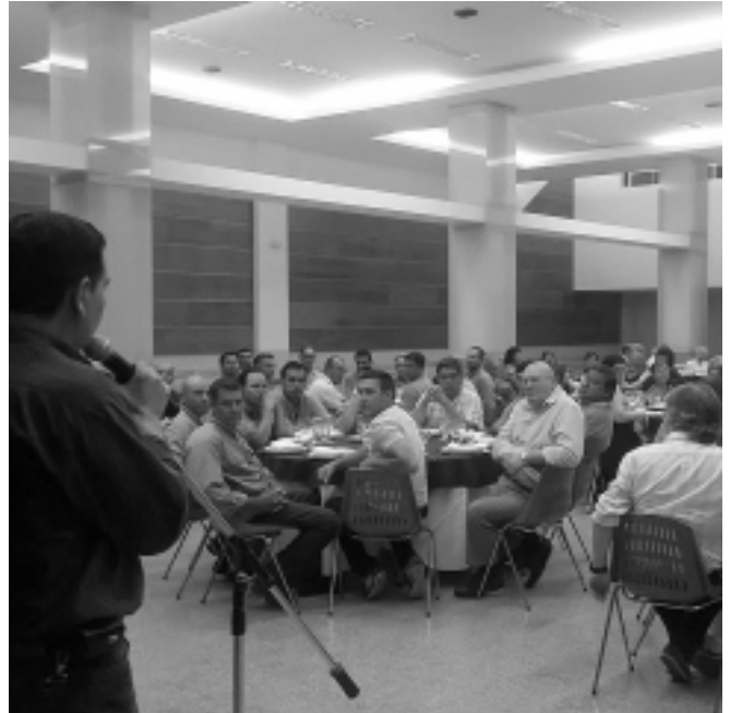
Imagen de la anterior edición del tradicional almuerzo.

Es necesario aclarar que aquel compañero que se hubiere anotado, y sin motivo justificado no tomara parte del festejo, se le descontará el valor que el servicio