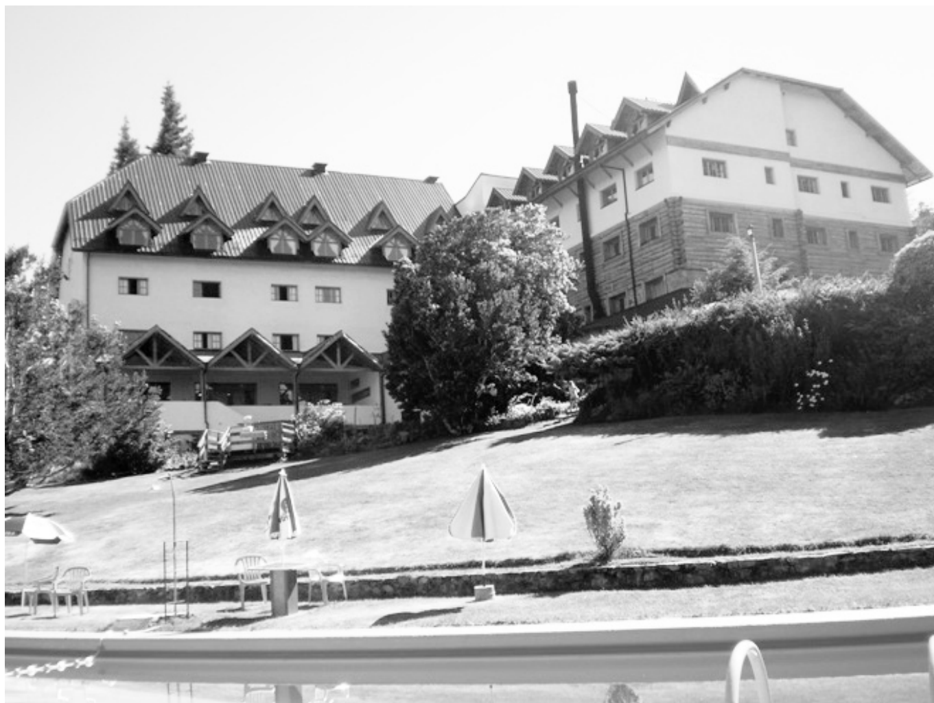
Hotel «Amancay», en Bariloche.