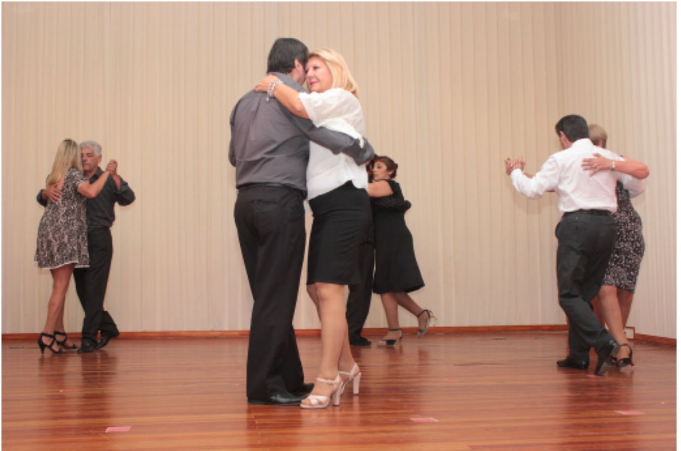
Los talleristas mostraron los trabajos realizados durante el año lectivo 2016.