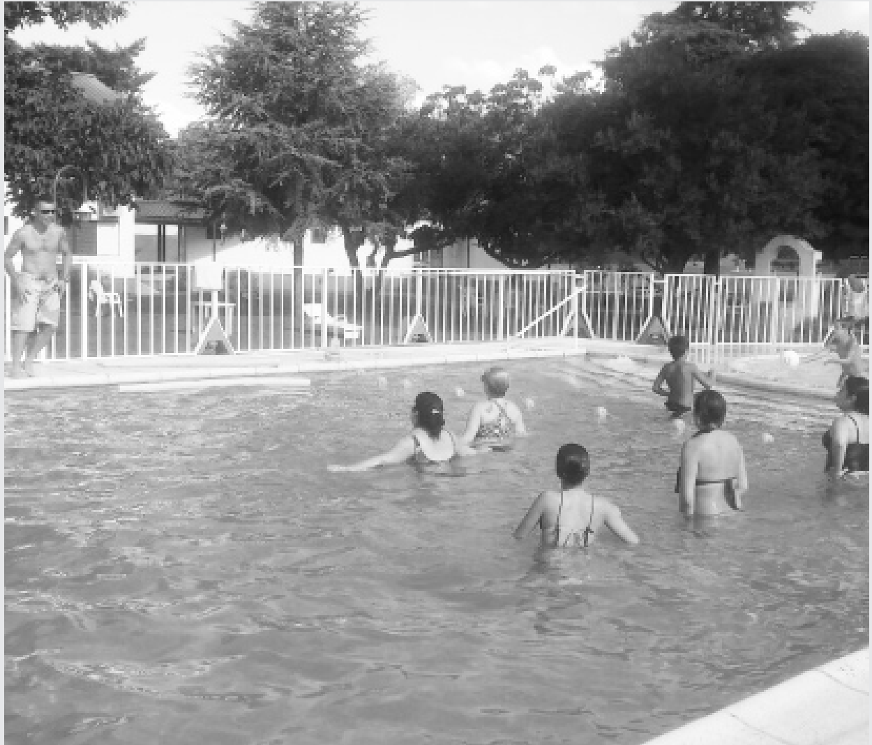
Aqua Gym en la pileta de Villa del Dique.

■ LA COMISIÓN DIRECTIVA DE NUESTRA ORGANIZACIÓN SINDICAL PONE EN CONOCIMIENTO DE LOS AFILIADOS QUE SE HAN PREVISTO ACTIVIDADES EN LOS ESPACIOS RECREATIVOS CON QUE CUENTA EL SINDICATO, CUYO DETALLE INFORMAMOS A CONTINUACIÓN: