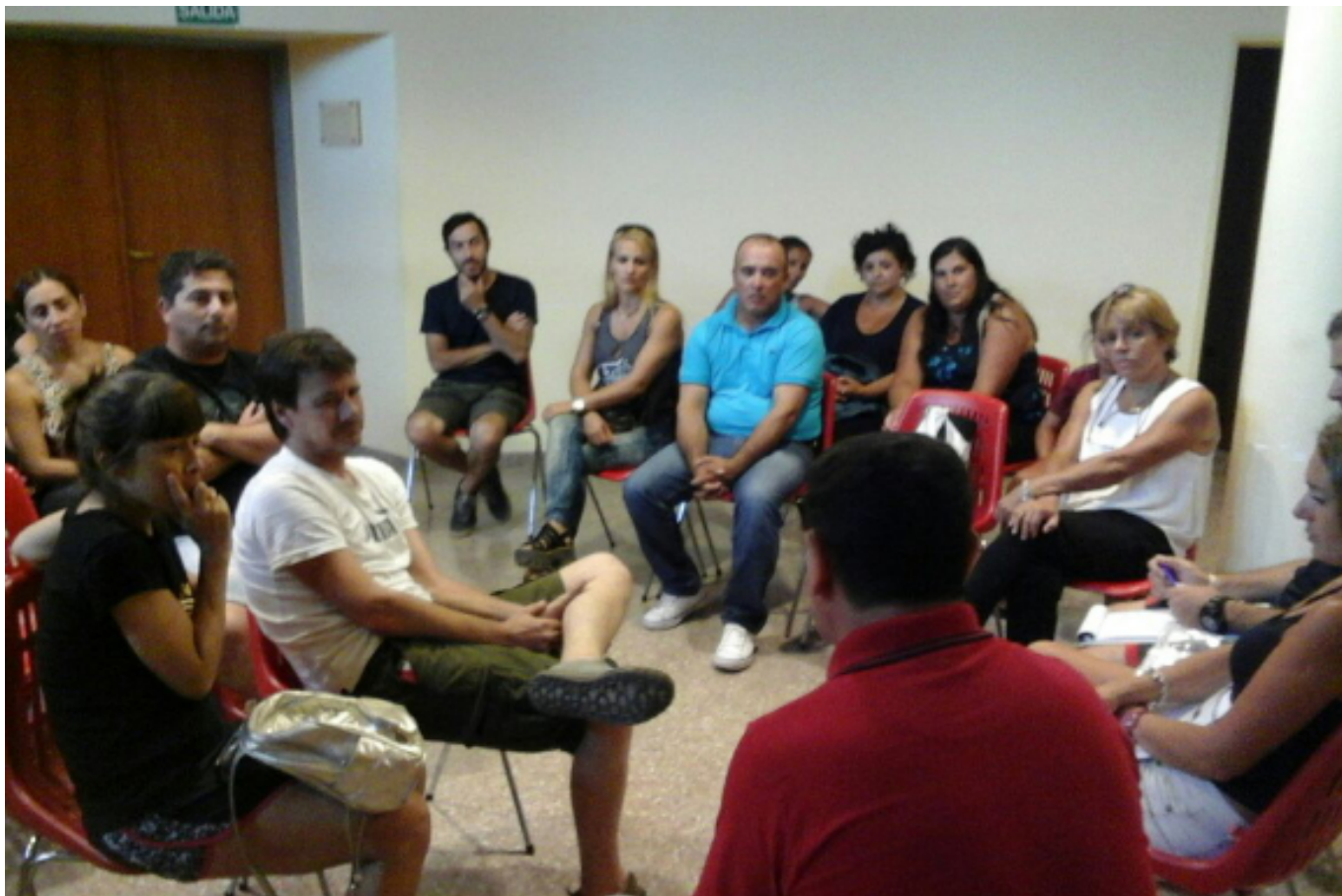
Reunión con padres de los niños que participarán del acantonamiento, para coordinar detalles del viaje a Villa del Dique.

ENTRE LOS DÍAS LUNES 30 Y MARTES 31, UNOS 27 NIÑOS QUE ASISTEN A LA COLONIA INFANTIL QUE SE REALIZA EN EL COMPLEJO POLIDEPORTIVO "CRO. SERGIO R TRABUCCO" PARTICIPARÁN DE UN ACANTONAMIENTO QUE SE REALIZARÁ EN EL PREDIO DE NUESTRA COLONIA DE VACACIONES DE VILLA DEL DIQUE.