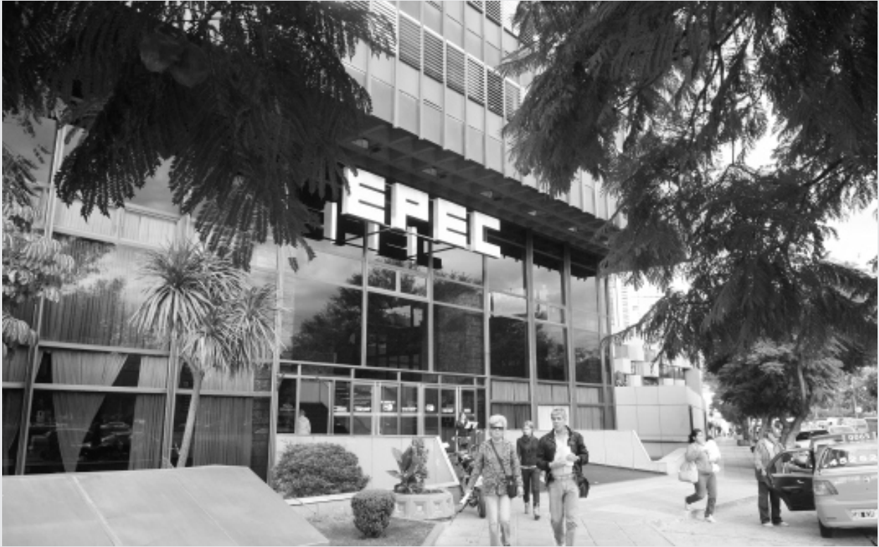
Sede central de la EPEC, donde se acordó el cronograma de pago de la BAE.

■ LUEGO DE REUNIONES MANTENIDAS ENTRE LAS ORGANIZACIONES GREMIALES DE LUZ Y FUERZA DE LA PROVINCIA Y LA EPEC, SE ACORDÓ UN CRONOGRAMA DE PAGO DE LA BAE, EL QUE QUEDÓ FIJADO EN CUATRO GRUPOS, DE LA SIGUIENTE MANERA: