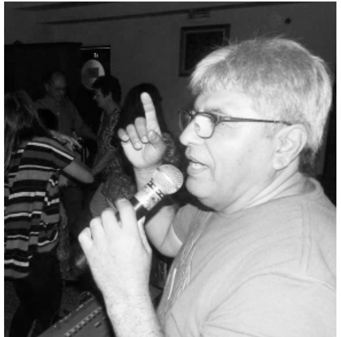
Miguel García le pone música a los sábados de la Colonia.

El destacado músico Miguel García brindará su show este sábado 25, el domingo 26 y el sábado 4 de marzo, con lo cual concluirá la serie de espectáculos que también lo tuvo a Julián Odelis como animador. ■