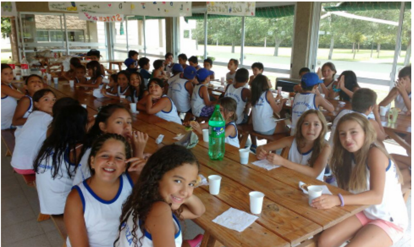
Uno de los pocos momentos de relajación, la hora de la merienda.

El acantonamiento, dirigido por los profesores que asisten a los chicos en la Colonia, es una práctica habitual cada año durante el desarrollo de la Colonia, pero esta es la primera vez que se llevó a cabo en Villa del Dique. ■