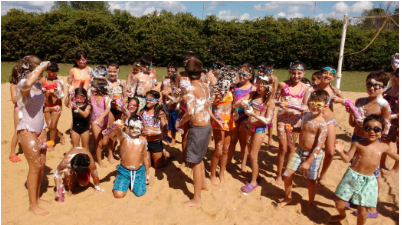
La alegría desbordó en la Fiesta de la Espuma (arriba). Al concluir la Colonia, se entregaron certificados de asistencia.