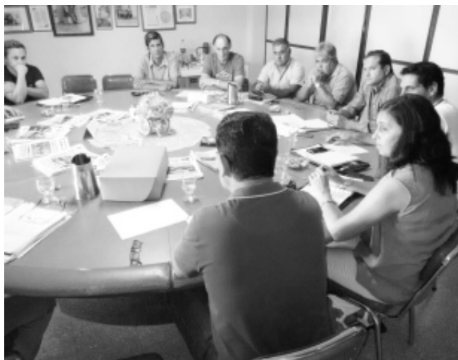
Momentos de la última sesión de la Comisión Directiva.

Santiago del Estero, Bariloche y San Nicolás. Por último, la Secretaría General informó sobre la reunión mantenida días atrás entre representaciones gremiales de Luz y Fuerza de la provincia y autoridades de EPEC con el ministro de Energía de la Nación, Juan José Aranguren. ■