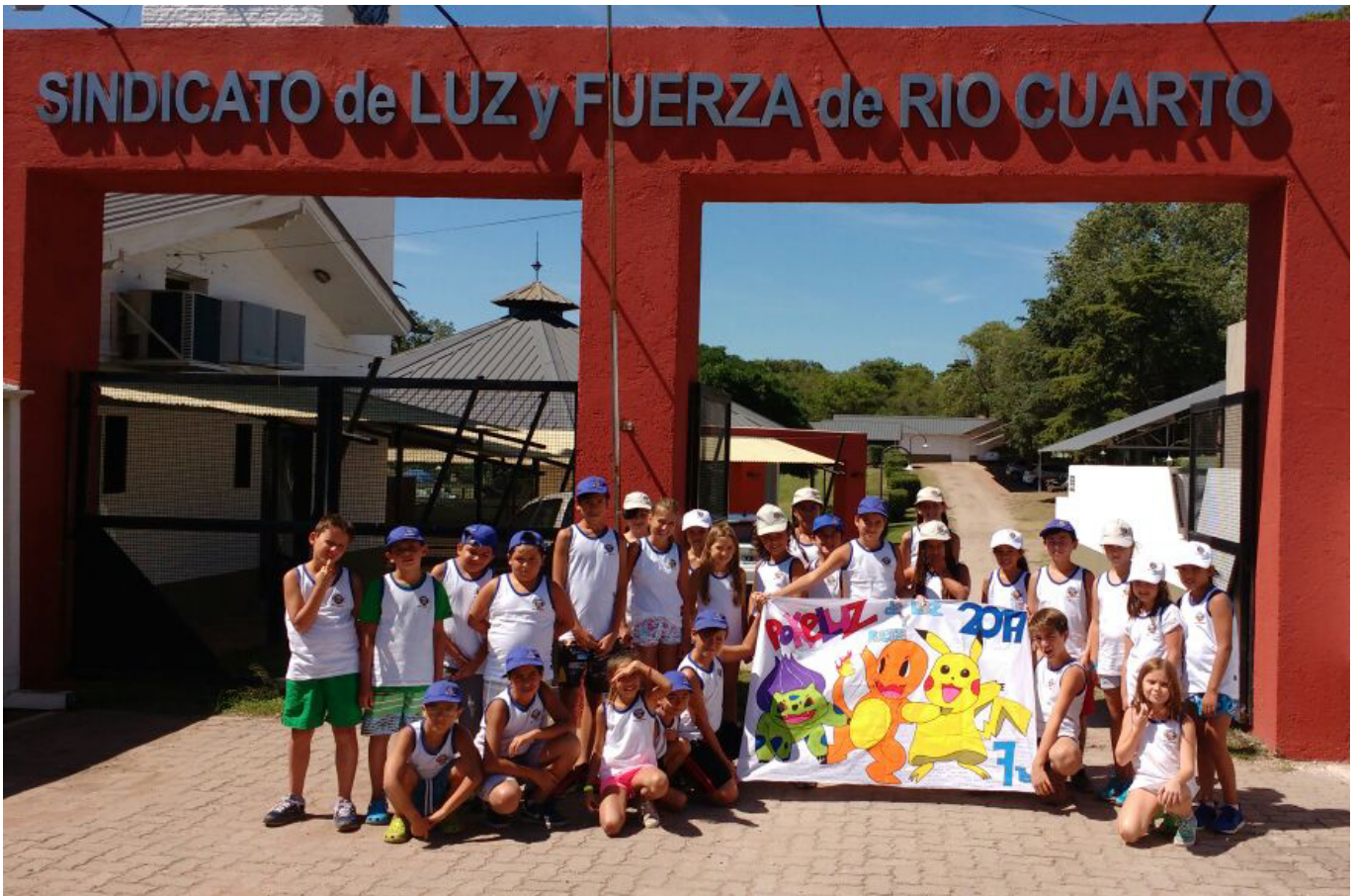
Los chicos acamparon en el predio de la Colonia de Vacaciones de Villa del Dique y realizaron allí varias actividades.