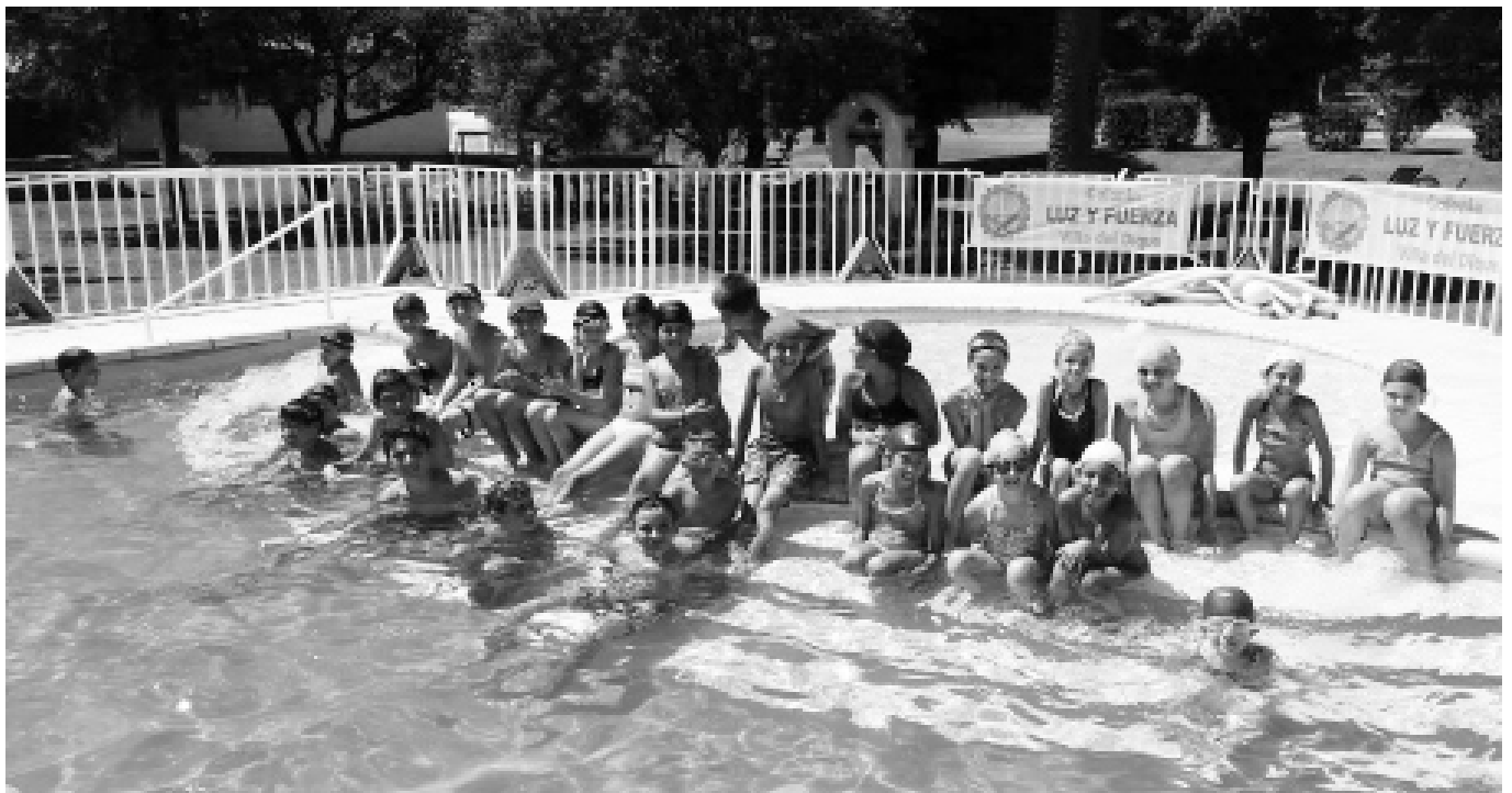
La pileta de natación fue la atracción principal que interesó a los niños.

Las actividades continuaron hasta la hora de la merienda y finalmente, alrededor de las 19:30, emprendieron el regreso a la ciudad de Río Cuarto, concluyendo de este modo una experiencia que dejó contentos a los chicos y satisfechos a los coordinadores, lo que alienta a repetir la experiencia en años sucesivos.