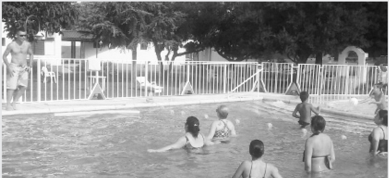
Aqua Gym en la pileta de Villa del Dique.

■ LA COMISIÓN DIRECTIVA DE NUESTRA ORGANIZACIÓN SINDICAL PONE EN CONOCIMIENTO DE LOS AFILIADOS QUE SE HAN PREVISTO ACTIVIDADES EN LOS ESPACIOS RECREATIVOS CON QUE CUENTA EL SINDICATO, CUYO DETALLE INFORMAMOS A CONTINUACIÓN: