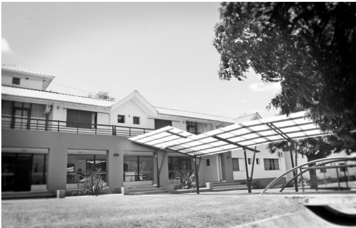
Sector de habitaciones de nuestra Colonia de Vacaciones de Villa del Dique.

■ NUESTRA ORGANIZACIÓN SINDICAL COMUNICA QUE LA SECRETARÍA DE TURISMO SOCIAL SE ENCUENTRA RECIBIENDO INSCRIPCIONES DE AQUELLOS AFILIADOS QUE DESEEN ALOJARSE EN LA COLONIA DE VACACIONES DE VILLA DEL DIQUE DURANTE EL PRÓXIMO FIN DE SEMANA