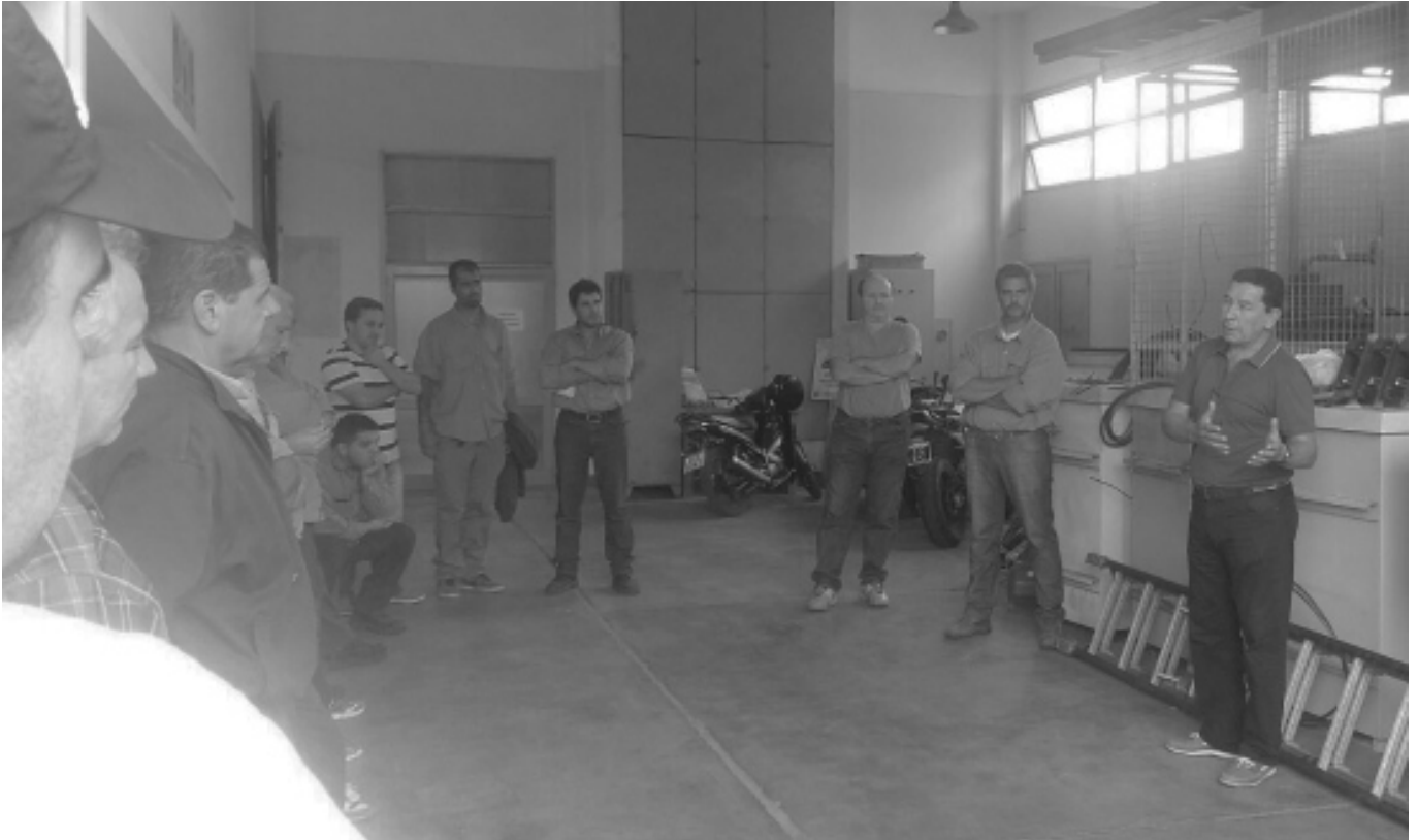
Integrantes de la Comisión Directiva recorrieron los distintos lugares de trabajo de la EPEC.