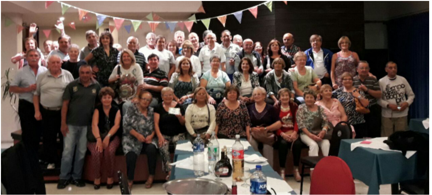
Integrantes del contingente de jubilados y pensionadas que viajaron gratuitamente a Villa Gesell.

■ EL SÁBADO 4 DEL CORRIENTE PARTIERON RUMBO A VILLA GESELL 50 COMPAÑEROS JUBILADOS Y PENSIONADAS, EN EL MARCO DE UN PROGRAMA ESPECIAL QUE LLEVA ADELANTE LA FEDERACIÓN ARGENTINA DE TRABAJADORES DE LUZ Y FUERZA.