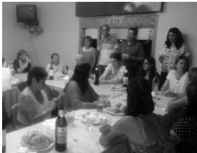
Momentos de la reunión realizada el miércoles pasado.

desde la casa, con compromiso y dedicación hacia sus familias, la tarea de los hombres que llevan adelante responsabilidades en diversas actividades, que los obligan a ausentarse durante largas horas de sus hogares. ■