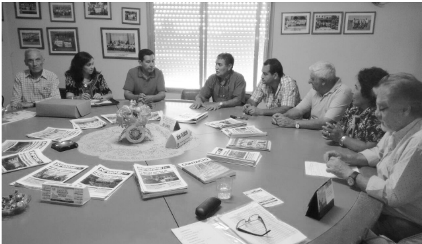
Instante del encuentro llevado a cabo el jueves pasado, en la oficina de la Comisión de Jubilados.