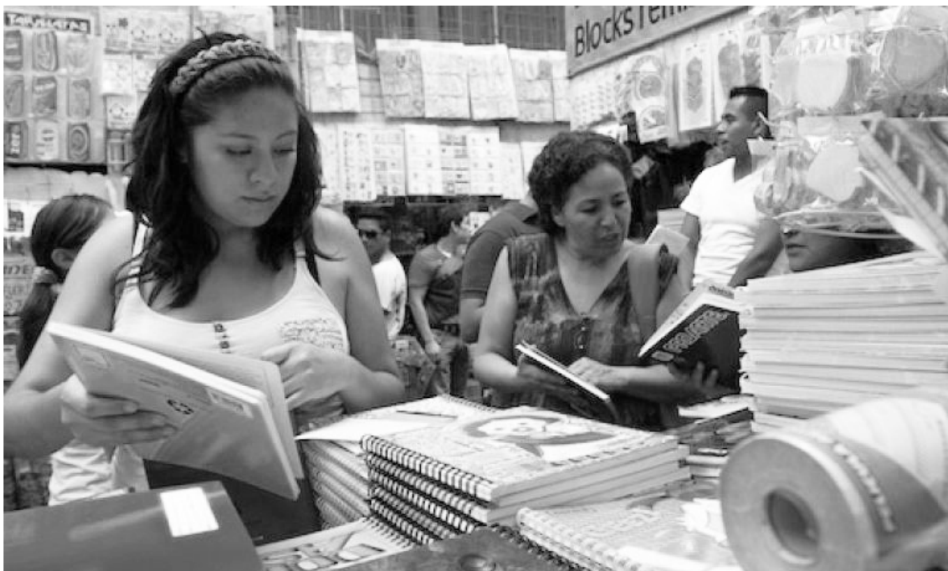
Los bonos contribuyen a la economía familiar de los compañeros lucifuerzistas.