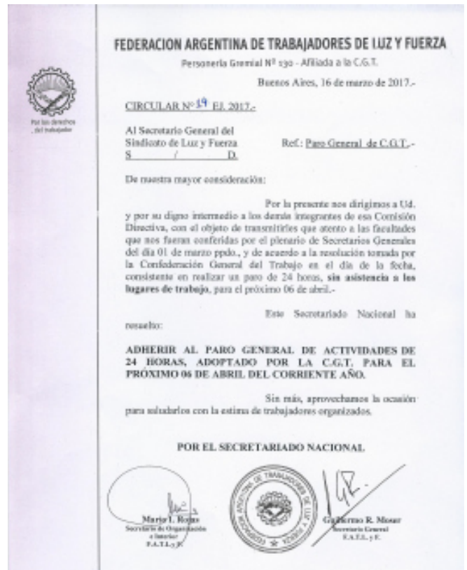
Copia de la nota recibida de la Federación.