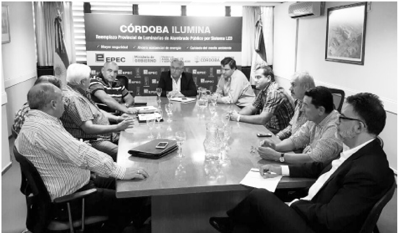
El presidente interino de la EPEC dialoga con los representantes de los tres sindicatos de Luz y Fuerza de la provincia.