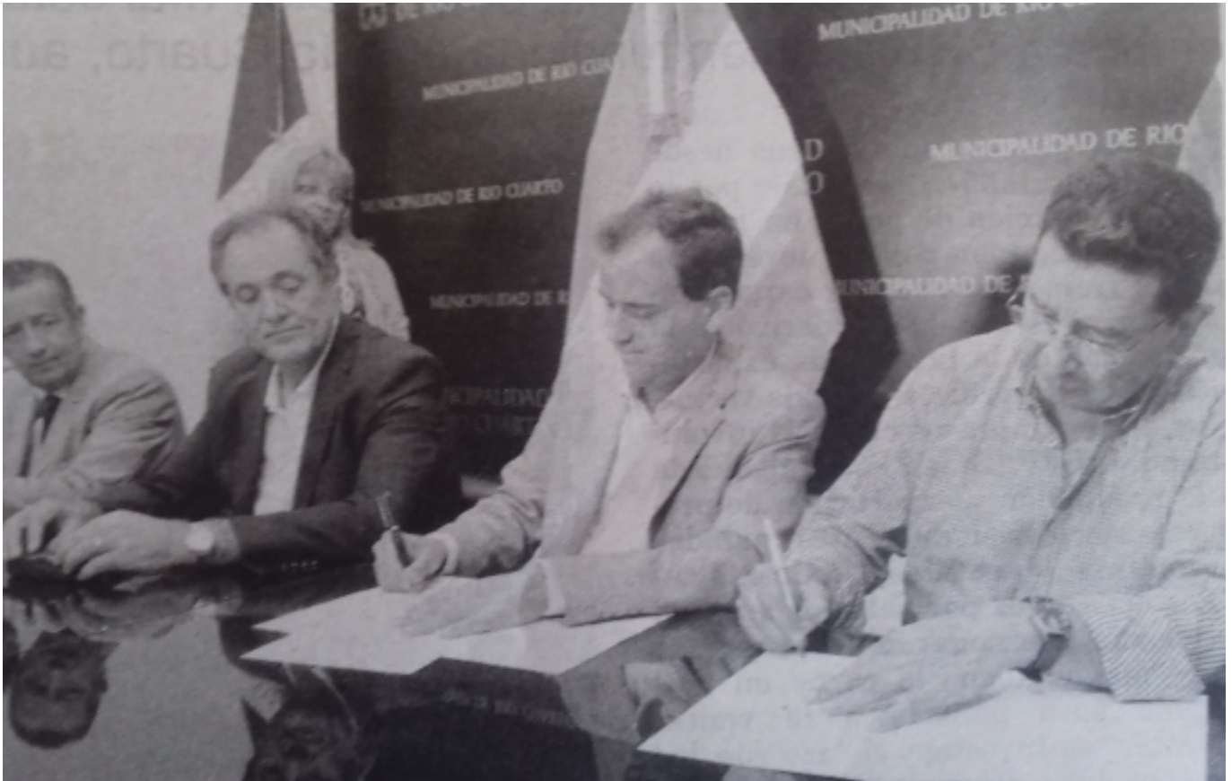
Momento de la firma del convenio.