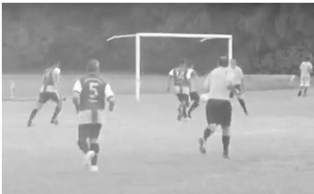
Instante del partido jugado por Luz y Fuerza durante la primera fecha del torneo.

A continuación publicamos la tabla de posiciones.