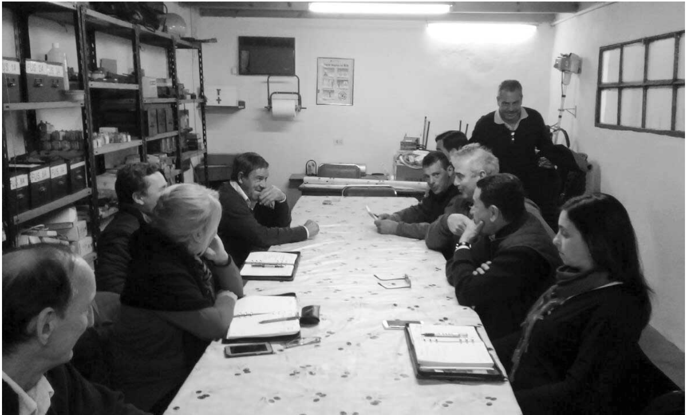
La conducción se reunió con afiliados de Villa Huidobro, Italo y Buchardo.

tamente con los afiliados, transmitir el trabajo que efectúa la organización y recabar inquietudes. ■