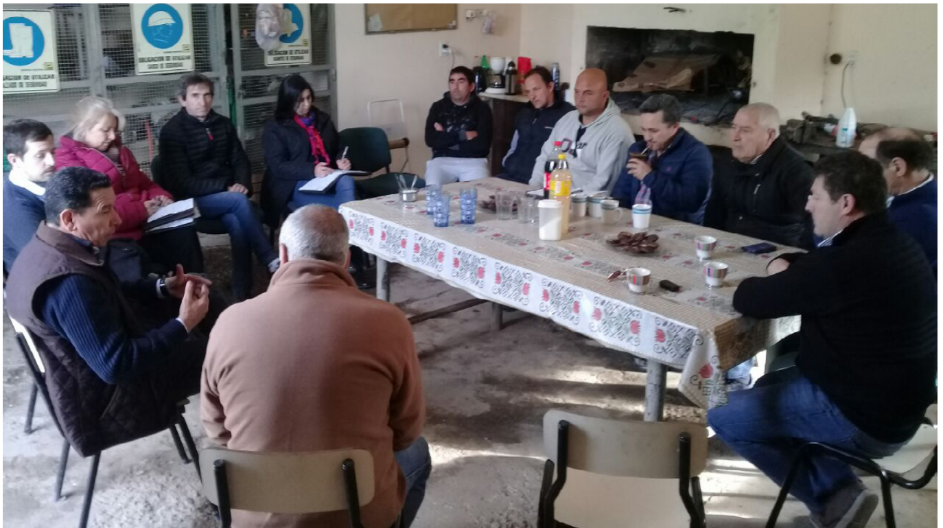
Una de las reuniones realizadas durante la gira por las seccionales de Villa Huidobro, Italó y Buchardo.