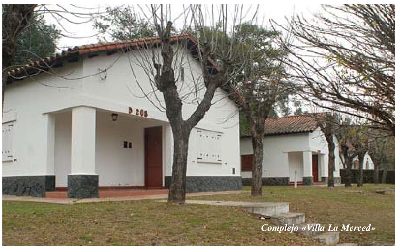
Complejo «Villa La Merced»