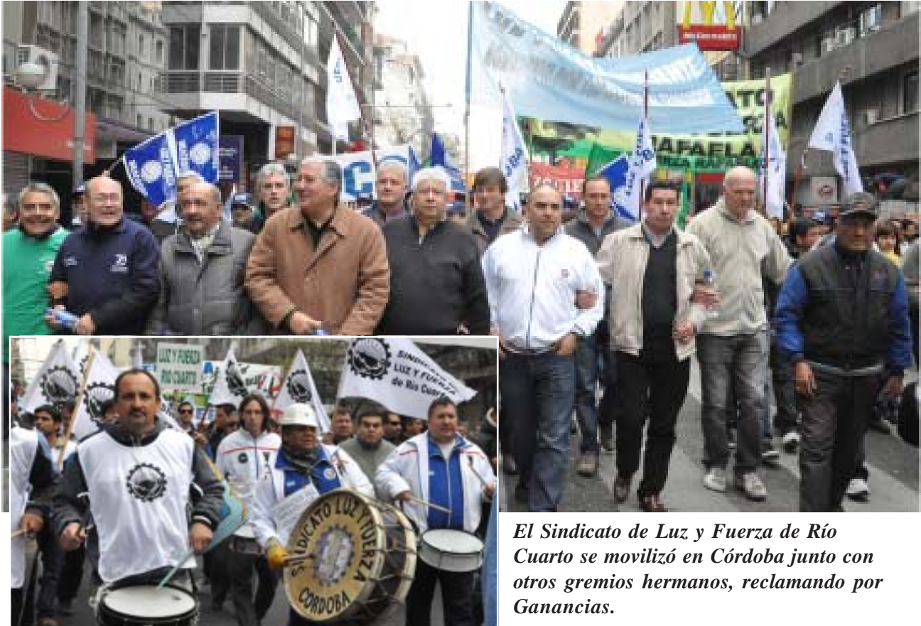
El Sindicato de Luz y Fuerza de Río Cuarto se movilizó en Córdoba junto con otros gremios hermanos, reclamando por Ganancias.

En los últimos días la Justicia Federal de Córdoba declaró «admisibile» el recurso extraordinario planteado ante la Corte Suprema de Justicia de la Nación por gremios estatales cordobeses -entre ellos el Sindicato de Luz y Fuerza de Río Cuarto- en contra de la forma de cálculo que se utiliza para cobrar el Impuesto a las Ganancias a los trabajadores.