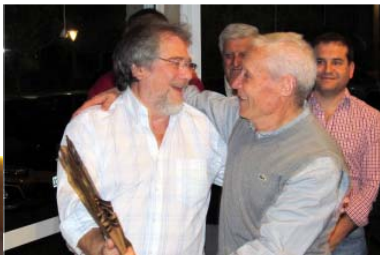
Instantes de la cena de camaradería realizada el jueves, con la asistencia también de miembros de la Comisión Directiva.