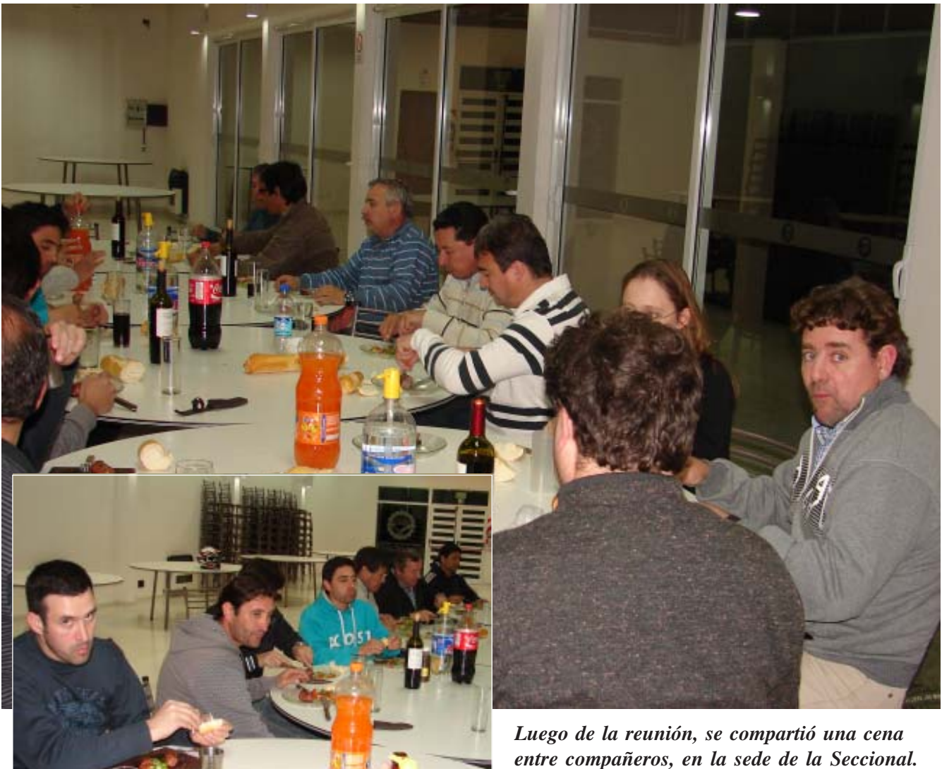
Luego de la reunión, se compartió una cena entre compañeros, en la sede de la Seccional.

Párrafo aparte merece el tratamiento abordado con los compañeros del tema de plantel básico de la Cooperativa de Electricidad de Adelia María, teniendo en cuenta las distintas categorías, de acuerdo con la antigüedad de los trabajadores, lo cual llevará primero a la elaboración de un proyecto por parte de la Secretaría Gremial del Sindicato, para luego ponerlo a consideración de todos los compañeros afiliados de la Seccional, tras lo cual será presentado ante el Consejo de la Cooperativa para su análisis.