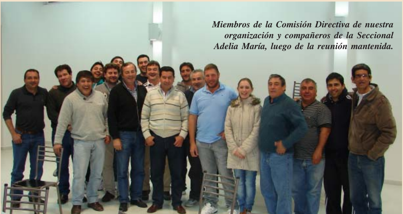
Miembros de la Comisión Directiva de nuestra organización y compañeros de la Seccional Adelia María, luego de la reunión mantenida.