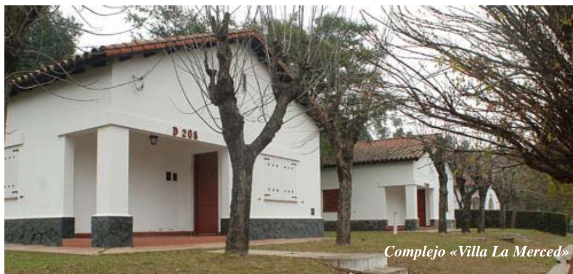
Complejo «Villa La Merced»

Tarifa válida para Complejo «Villa La Merced» (Los Molinos-Córdoba):