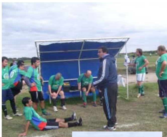
La Charla técnica previa al encuentro.