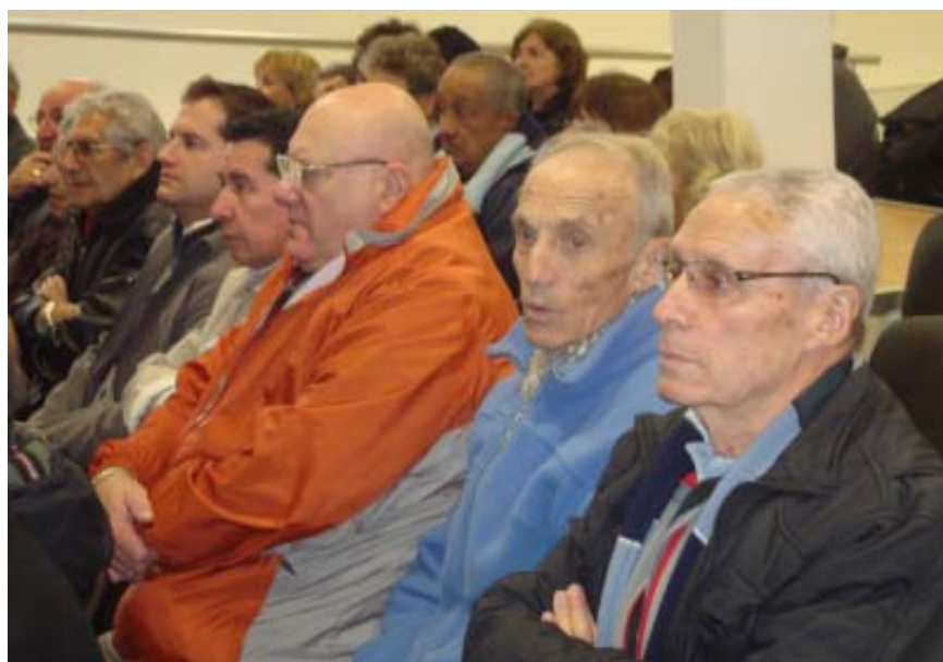
Presencia de nuestro Sindicato en el encuentro con el titular de la Caja.

presencia en las decisiones que se tomen respecto del funcionamiento de la Caja, teniendo en cuenta que los dueños de ella somos los aportantes activos y los compañeros jubilados, lo que fundamenta nuestra petición.