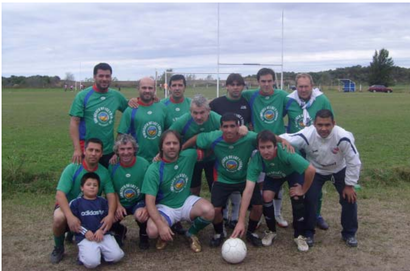
El representativo de Luz y Fuerza en el Torneo Unidos del Sur.