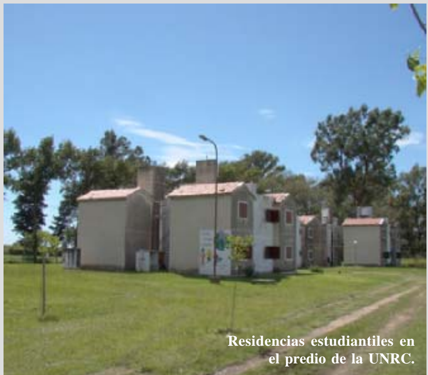
Residencias estudiantiles en el predio de la UNRC.

La Secretaría de Organización y Asuntos Energéticos reitera a los compañeros afiliados de las seccionales que se encuentra habilitado el registro de aspirantes a ocupar las residencias universitarias que posee nuestra organización en el predio de la Universidad Nacional de Río Cuarto, por lo cual los interesados deberán comunicarse a la mayor brevedad con la Secretaría mencionada.