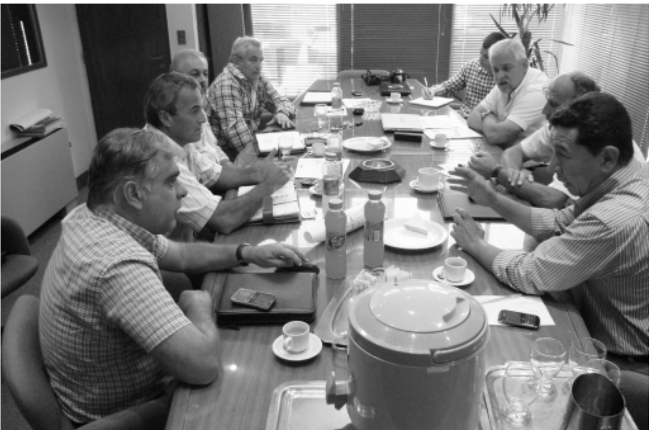
La Comisión sesionó en la sala de reuniones de la Secretaría Gremial de nuestro Sindicato.

La Comisión Mixta de Higiene y Seguridad (conocida habitualmente como comisión cuatripartita) está integrada por el Sindicato Regional de Luz y Fuerza, el Sindicato de Luz y Fuerza de Río Cuarto, la FATLYF, las federaciones patronales FACE y FE-CESCOR, el Estado nacional a través de la Superintendencia de Riesgos de Trabajo y el Ministerio de Trabajo de la Provincia de Córdoba, además de la Agencia Córdoba Empleo.