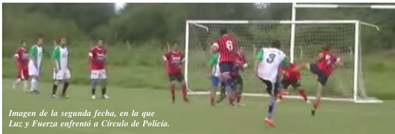
Imagen de la segunda fecha, en la que Luz y Fuerza enfrentó a Círculo de Policía.