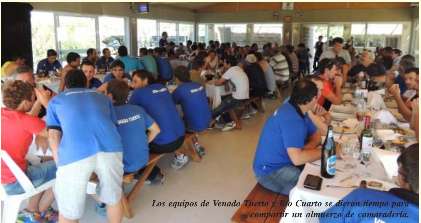
Los equipos de Venado Tuerto y Río Cuarto se dieron tiempo para compartir un almuerzo de camaradería.

Río Cuarto se clasificó en siete de las ocho disciplinas