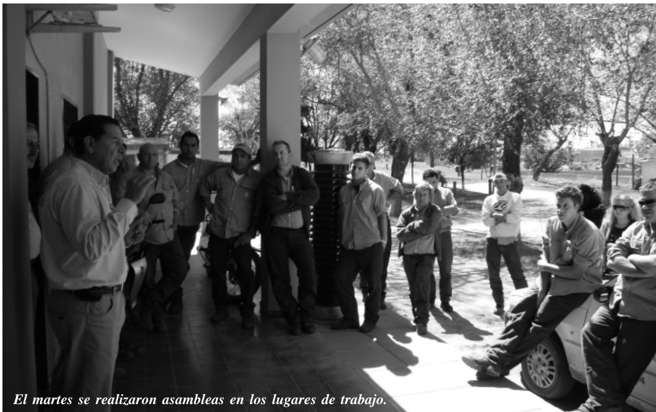
El martes se realizaron asambleas en los lugares de trabajo.

El próximo miércoles 8 del corriente los sindicatos adheridos a la Federación Argentina de Trabajadores de Luz y Fuerza realizarán un paro por 24 horas, en reclamo por la injusta aplicación del Impuesto a las Ganancias sobre el salario de los trabajadores.