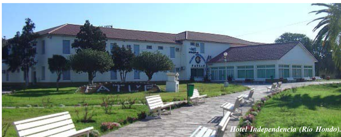
Hotel Independencia (Río Hondo).

Nuestra Federación comunicó las nuevas tarifas en tránsito, por día, por persona, con desayuno, vigente a partir del 1 de abril de 2015, las que se publican a continuación: