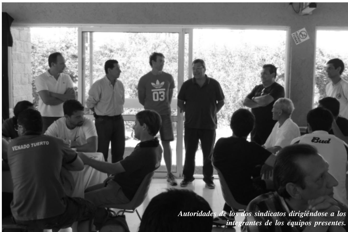
Autoridades de los dos sindicatos dirigiéndose a los integrantes de los equipos presentes.

En lo que constituye una situación que registra pocos antecedentes -por no decir ninguno- en nuestra organización, los equipos del Sindicato de Luz y Fuerza de Río Cuarto clasificaron en siete de las ocho disciplinas en las cuales enfrentaron al Sindicato de Luz y Fuerza de Venado Tuerto, en el marco de las eliminatorias del Campeonato Argentino «Oscar Smith».