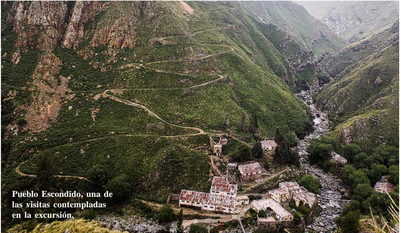
Pueblo Escondido, una de las visitas contempladas en la excursión.

Recordamos que durante los días 23, 24 y 25 de mayo se realizará una travesía interprovincial que abarcará Cerro Aspero y Los Molles, con el cruce de los Comechingones.