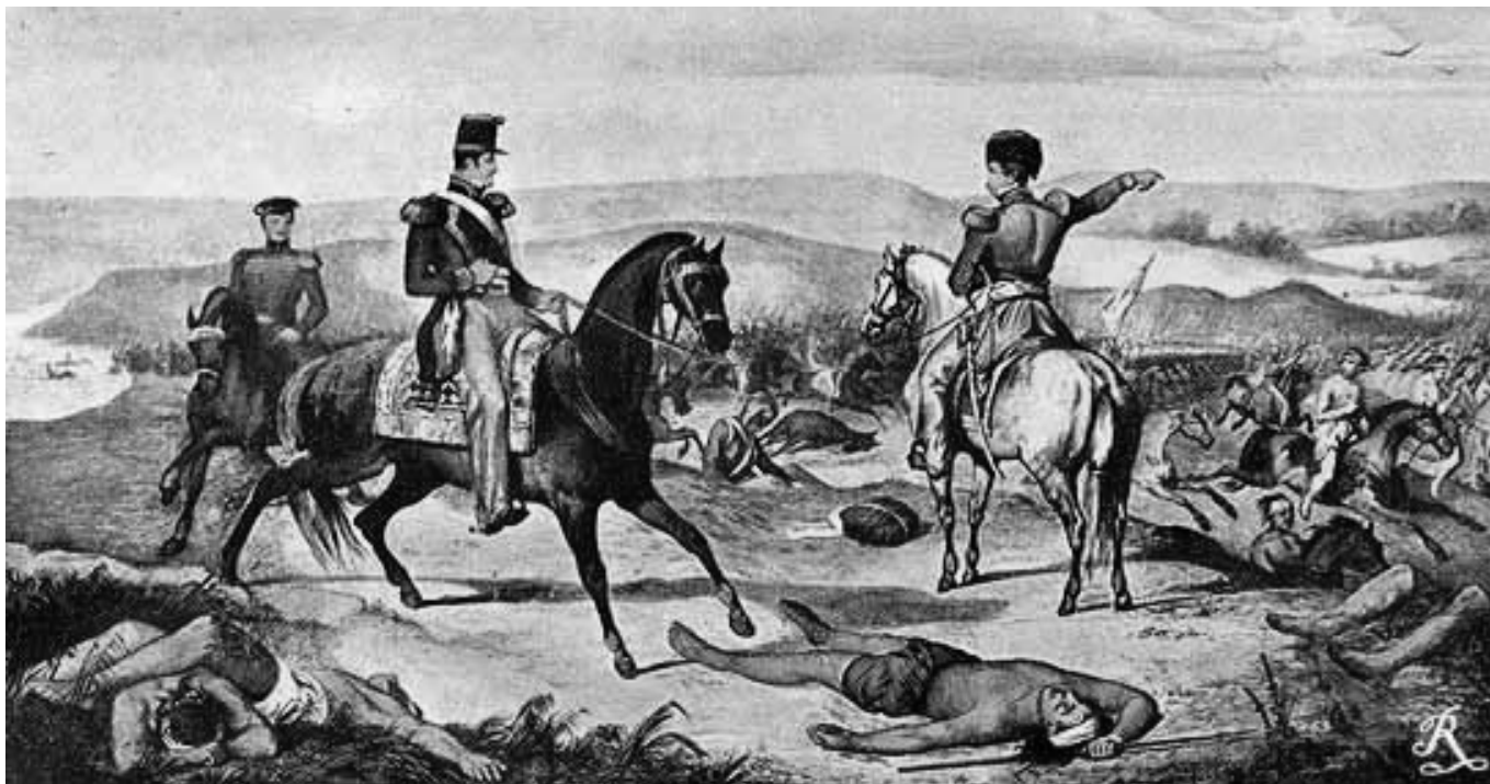
Pintura sobre la expedición al desierto, en la que aparece Rosas en primer plano.

dimiento Buenos Aires podía estimular cierta actividad económica del interior y boicotear otra, determinando qué mercadería extranjera y de qué países de procedencia podrá consumir el interior. Quedaban en manos de Buenos Aires las llaves para favorecer o empobrecer a determinados grupos sociales de las provincias.