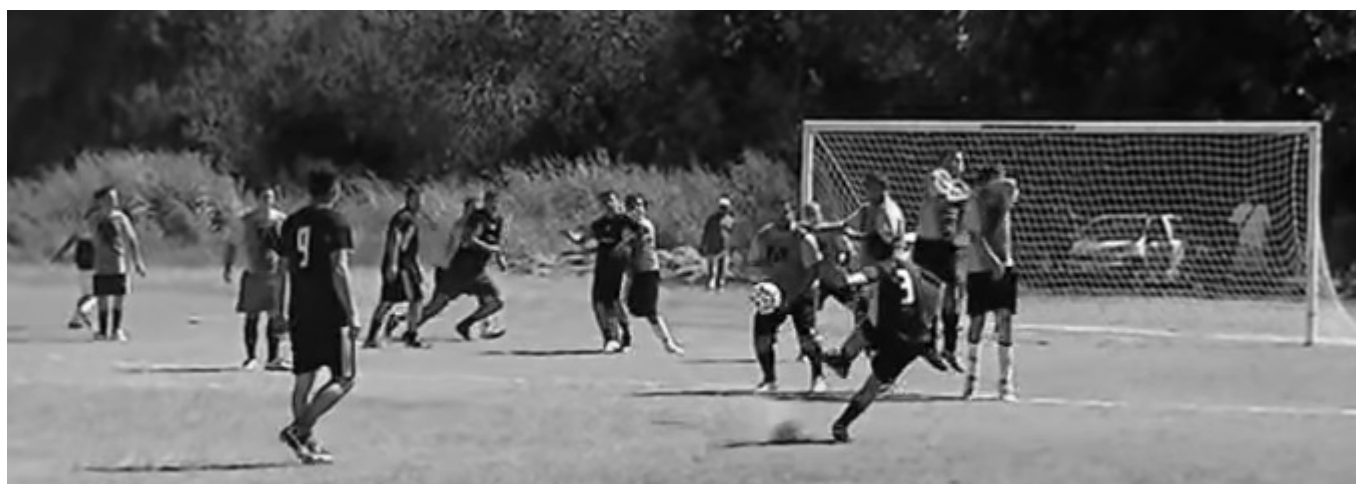
Imagen de uno de los partidos jugados en la tercera fecha, en la que Luz y Fuerza estuvo libre.