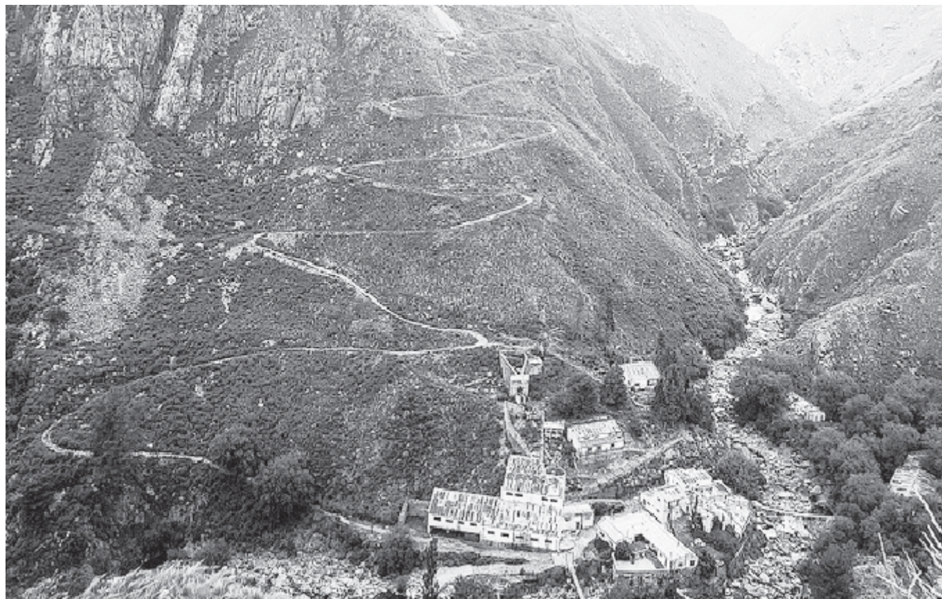
Pueblo Escondido , una de las paradas previstas en la excursión.