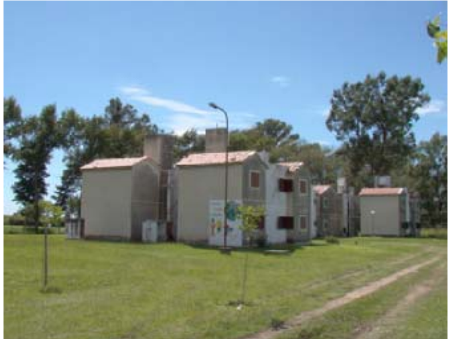
Residencias estudiantiles en el predio de la UNRC.

La Secretaría de Organización y Asuntos Energéticos reitera a los compañeros afiliados de las seccionales que se encuentra habilitado el registro de aspirantes a ocupar las residencias universitarias que posee nuestra organización en el predio de la Universidad Nacional de Río Cuarto, por lo cual los interesados deberán comunicarse a la mayor brevedad con la Secretaría mencionada.