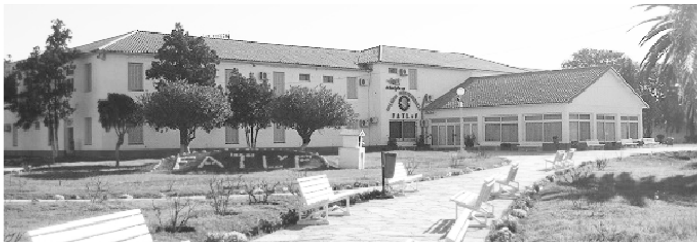
Hotel Independencia (Río Hondo).

SONA, CON DESAYUNO, VIGENTE A PARTIR DEL 1 DE ABRIL DE 2015, LAS QUE SE PUBLICAN A CONTINUACIÓN: