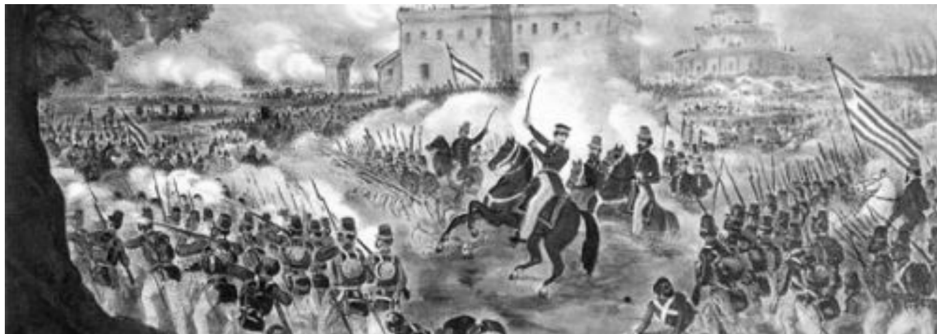
La Batalla de Caseros, en la que Urquiza derrotó a Rosas.

Según un informe que Rosas presentó al gobierno de Buenos Aires a poco de comenzar la campaña, el sal-