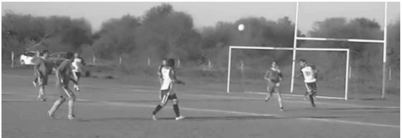
Instante de uno de los partidos jugados en la 5ta. fecha.