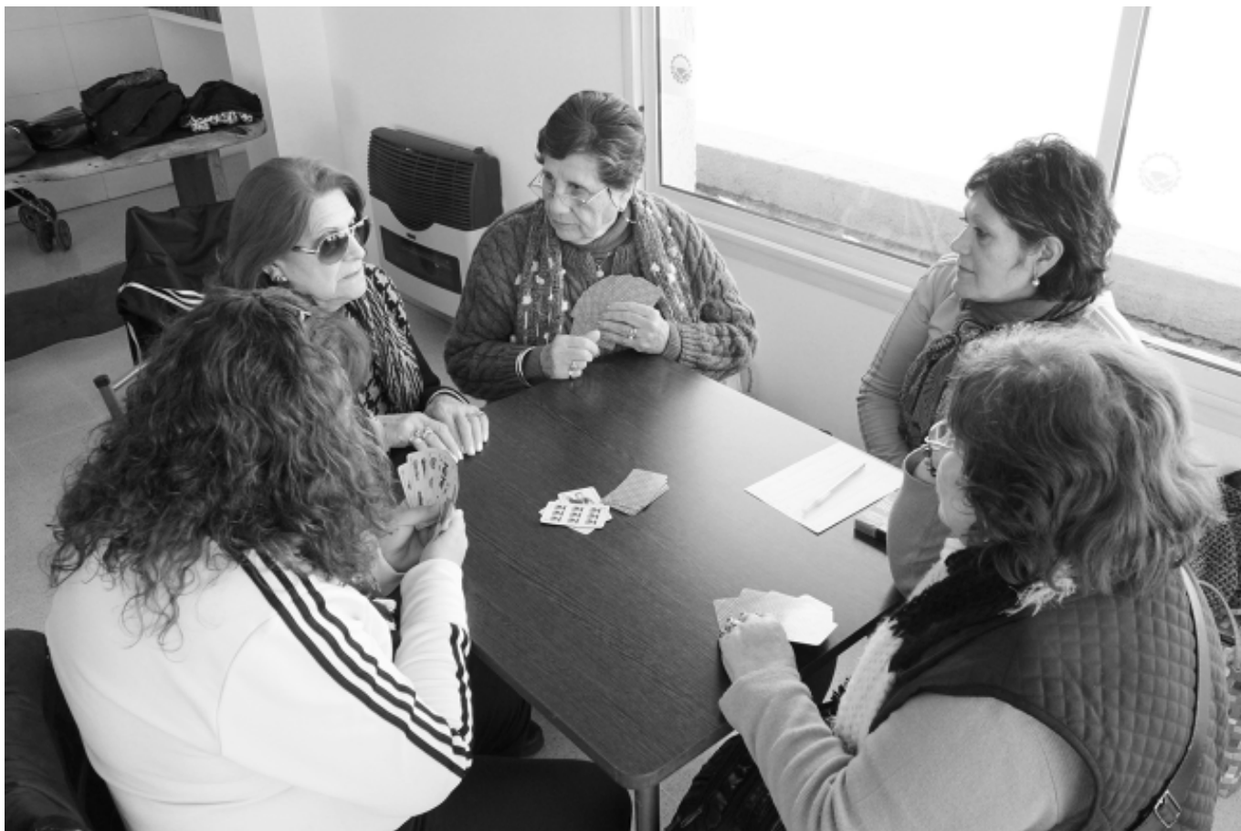
Las damas concentradas en el chinchón.