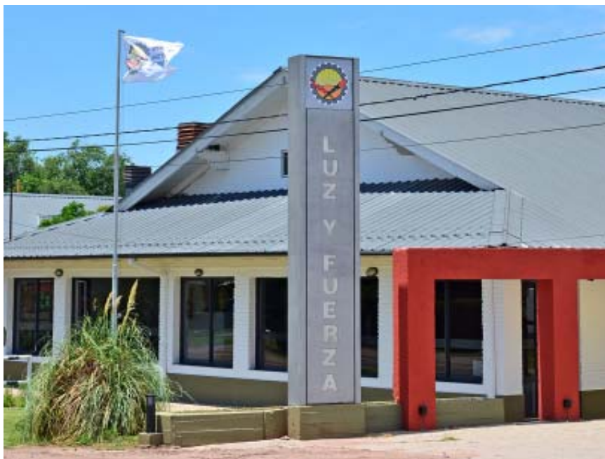
Colonia de Villa del Dique, escenario de la importante Jornada.