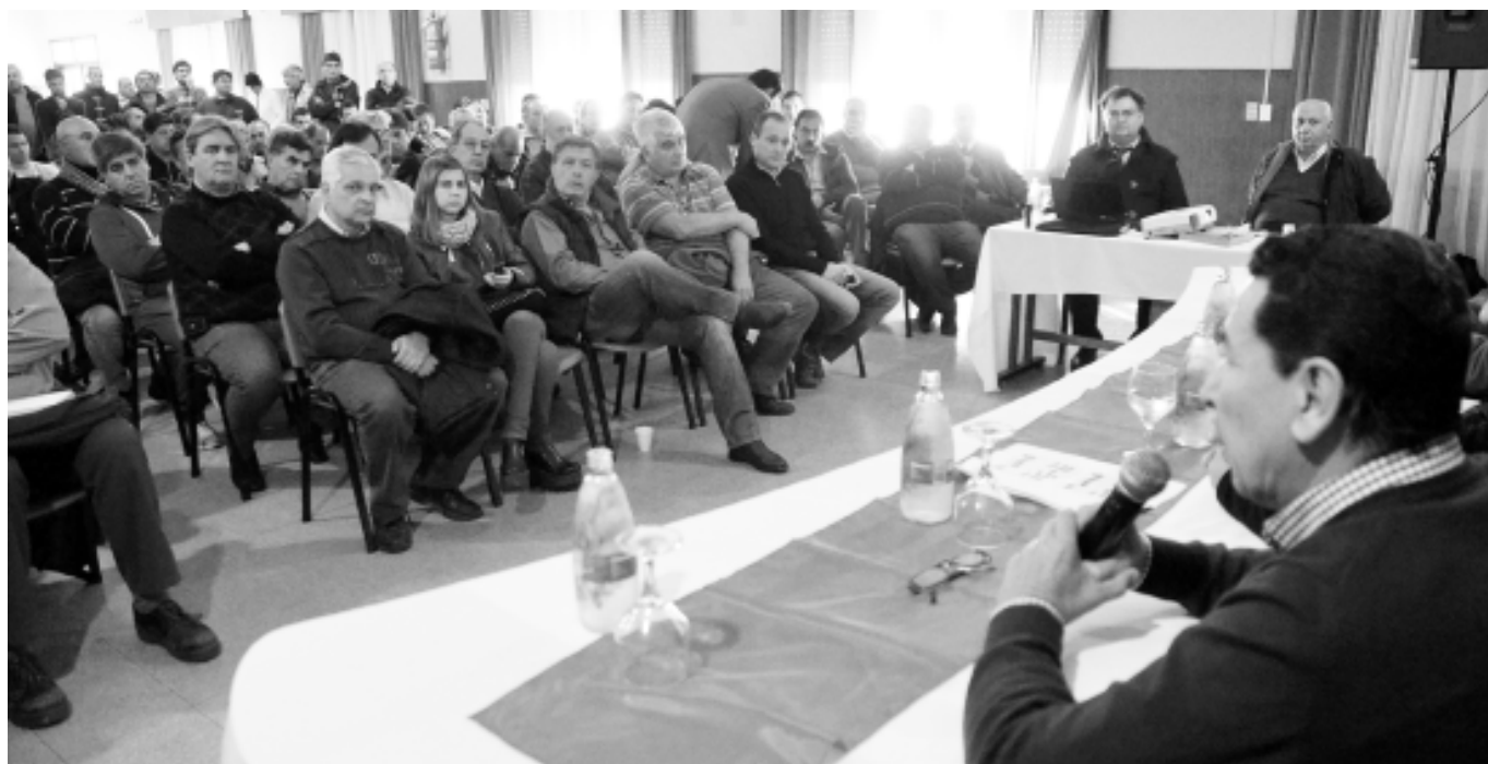
El salón del Sindicato Regional en Pilar se encontraba colmado de asistentes.

Chávez puso de relieve la necesidad de que los trabajadores continúen reforzando la unidad en la lucha por la defensa de la Empresa, encolumnados a través de las organizaciones sindicales, destacando la unidad y fortaleza que siempre han caracterizado a Luz y Fuerza cuando se trata de la defensa de los derechos de los trabajadores y su fuente de trabajo. ■