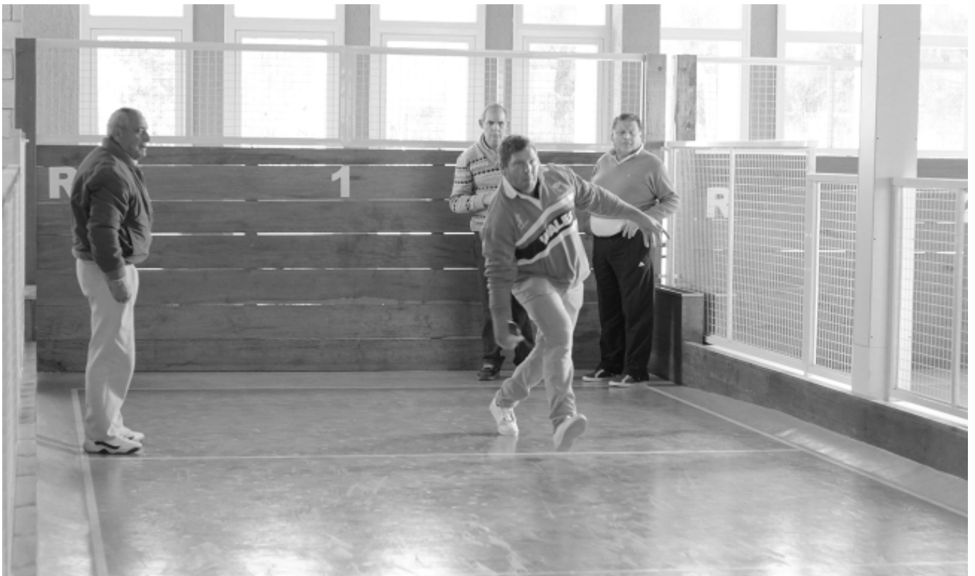
Tres compañeros observan al bochador, en plena tarea.

Por último, recordamos que la tradicional cena y baile tendrá lugar el sábado 18 de julio, en las instalaciones de la Sociedad Rural de Río Cuarto. ■