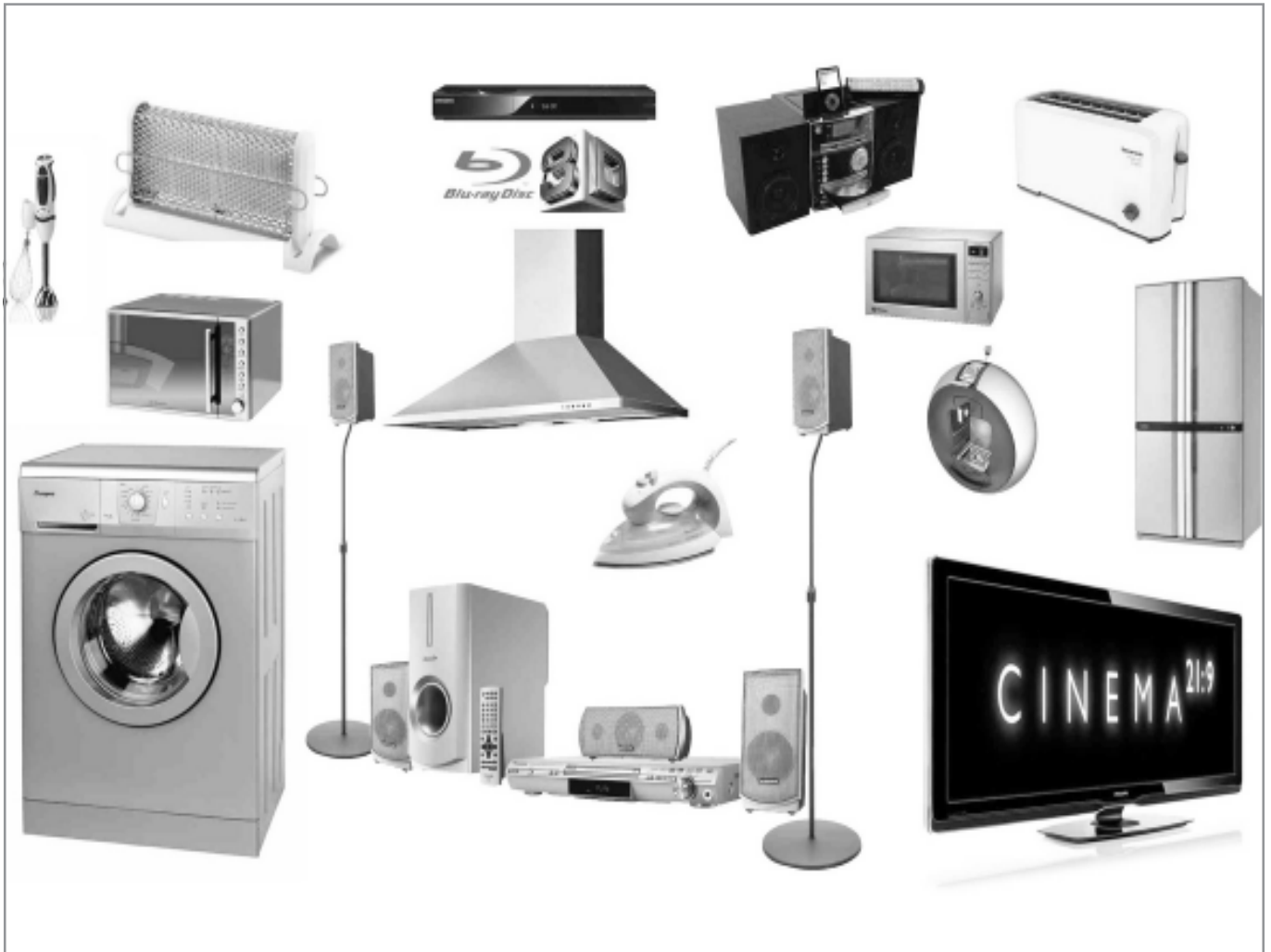
Es necesaria la elección de electrodomésticos eficientes en el consumo de energía.

nera eficaz y de mejorar constantemente nuestra calidad ambiental y, por lo tanto, nuestra calidad de vida. En diciembre de 1997 se firmó el Protocolo de Kioto, el instrumento legislativo más importante disponible para la limitación de las emisiones de gases de efecto invernadero. En él los países industrializados se comprometen a reducir sus emisiones de estos gases -aproximadamente un 5% en 2010 con respecto a 1990-. La modestia del objetivo da buena idea de la magnitud del problema, pues supone cambiar paulatinamente todo el modelo de producción y consumo de energía en nuestro planeta. Posteriormente han tenido lugar varias reuniones internacionales sobre el mismo tema, sin que se haya llegado a un consenso general sobre las medidas concretas a tomar para cumplir la resolución de Kioto.