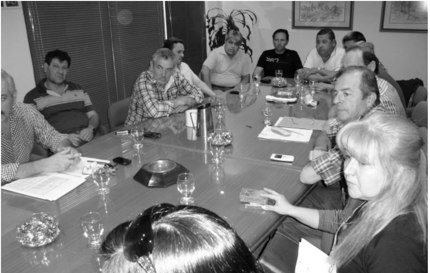
Momento de la reunión de Comisión Directiva en cuyo transcurso se abordaron varias cuestiones importantes.

EL VIERNES 28 DE AGOSTO, SE REUNIÓ DESDE LAS 17:00 NUESTRA COMISIÓN DIRECTIVA PARA ABORDAR UN IMPORTANTE TEMARIO, QUE LLEVÓ A REPASAR LAS CUESTIONES MÁS RELEVANTES EN LAS QUE SE ENCUENTRAN TRABAJANDO LAS DIFERENTES SECRETARÍAS DEL SINDICATO DE LUZ Y FUERZA DE RÍO CUARTO.