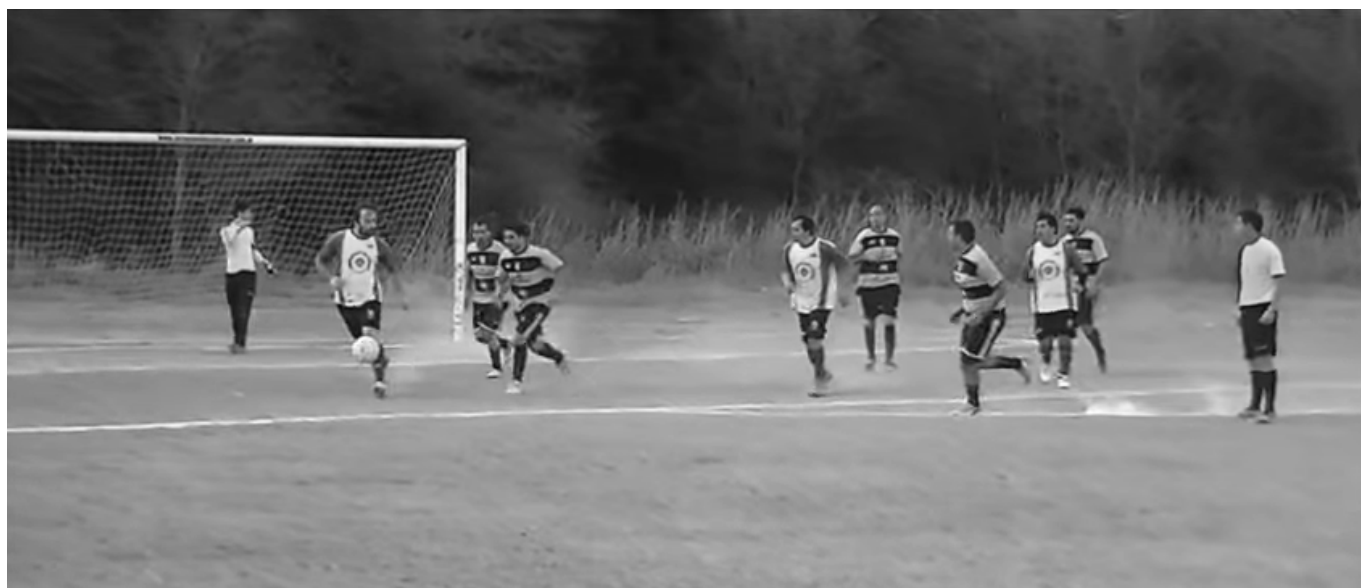
Instante de uno de los partidos jugados en la cuarta fecha del torneo.