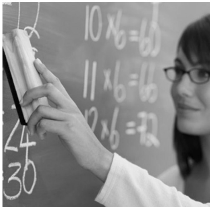
La maestra, símbolo del trabajo por vocación

El 11 de septiembre de 1943, durante la Primera Conferencia de Ministros y Directores de Educación de las Repúblicas Americanas, se resolvió homenajear la figura de Sarmiento como educador declarando al 11 de septiembre, fecha de la muerte del sanjuanino, Día del Maestro en todos los países americanos. La resolución decía: «Considerando: que es actividad fundamental de la escuela la educación de los sentimientos, por cuyo motivo no debe olvidarse que entre ellos figura en primer plano la gratitud y devoción debidas al maestro de la escuela primaria, que su abnegación