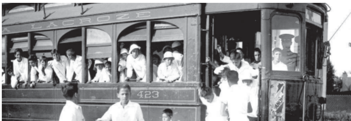
Alumnos llegan a la colonia de vacaciones (1936).

En 1870 Serena Frances Wood, que había creado en Virginia (EE.UU.) la primera escuela para los esclavos que acababan de ser liberados tras la guerra civil, fundó en Buenos Aires la Escuela Número 1 cerca de Retiro. Murió apenas un año después, víctima de la epidemia de fiebre amarilla. Serena y sus compañeras debieron enfrentar graves dificultades para poder ejer-