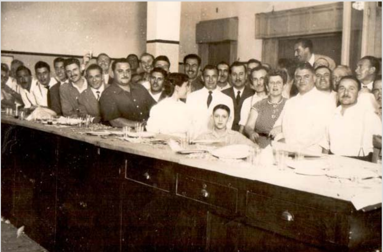
Compañeros de Luz y Fuerza, en pleno festejo, hace más de medio siglo.