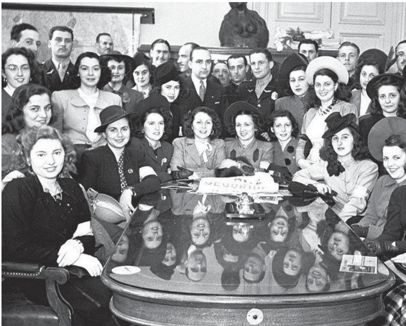
Un grupo de maestras en un agasajo realizado en Buenos Aires, en 1943.

cer su vocación, no obstante, aportaron lo mejor de sí para difundir la enseñanza en la Argentina.