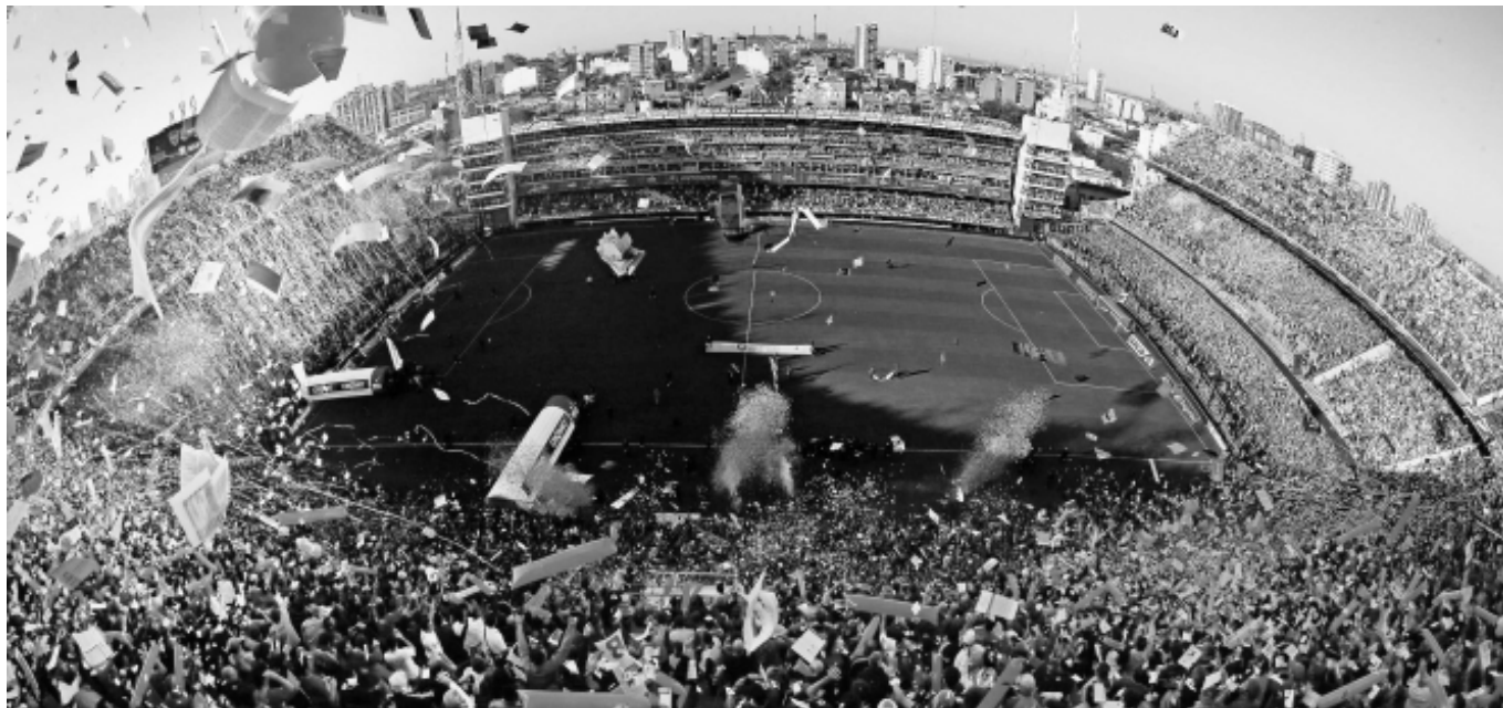
La «Bombonera» se ha convertido en un atractivo internacional.