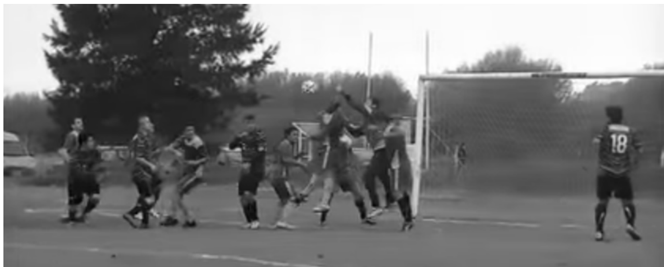
Instante de uno de los partidos jugados en la tercera fecha del Torneo Copa 2015.