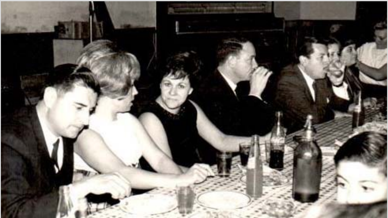
Una de las cenas de camaradería de Luz y Fuerza, hace ya algunas décadas.