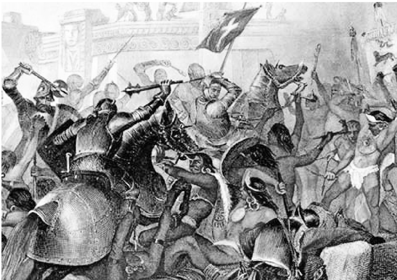
La lucha entre españoles y abórigenes fue muy desigual.

chos morían a causa del contagio de enfermedades que portaban los europeos y para las que ellos no tenían defensas. Pero la mayoría de la población de las Antillas se extinguió en apenas 20 años de contacto con los europeos, a causa de los malos tratos, los trabajos forzados y el cambio de vida, de cultura y de religión que les impusieron los conquistadores.