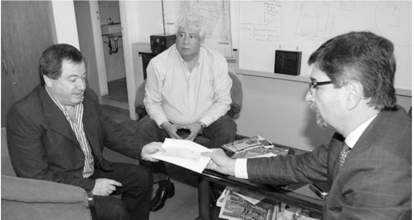
Momento de la firma del convenio entre FATLYF y EPEC.

■ LA FEDERACIÓN ARGENTINA DE TRABAJADORES DE LUZ Y FUERZA Y LA EMPRESA PROVINCIAL DE ENERGÍA DE CÓRDOBA FIRMARON RECIENTEMENTE UN CONVENIO, EL CUAL PERMITIRÁ QUE LOS HIJOS DE LOS TRABAJADORES DE LA EPEC PUEDAN DISFRUTAR DE LAS BONDADES DE UN COMPLEJO TURÍSTICO EN LA LOCALIDAD DE TANTI.