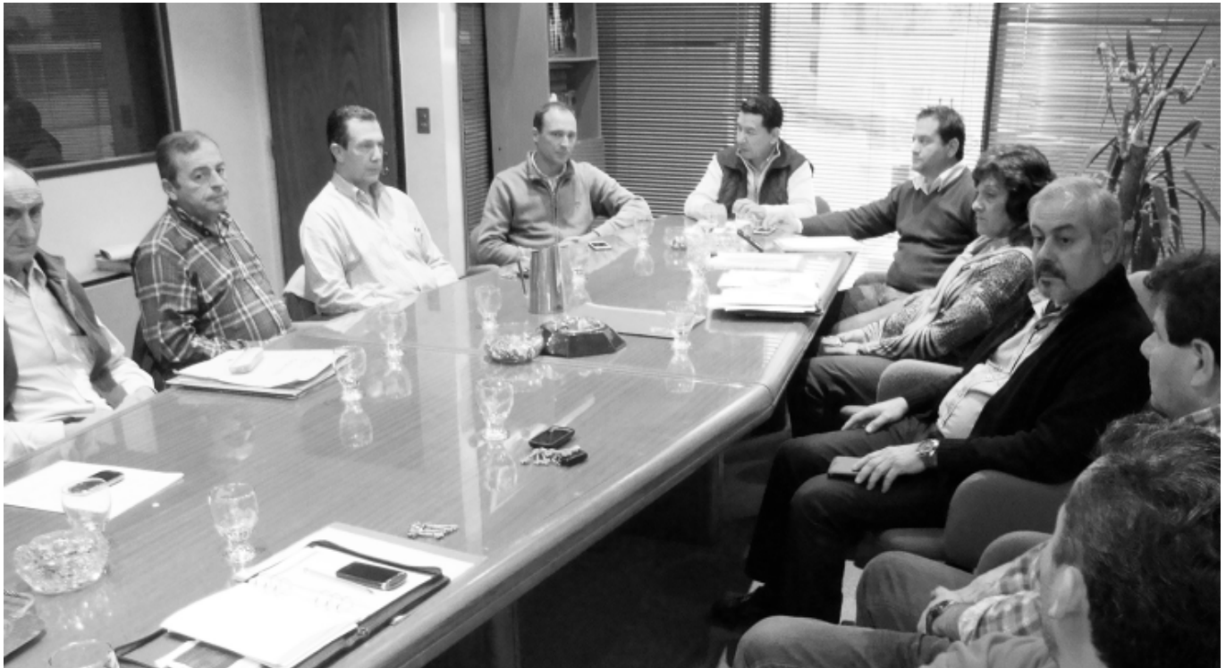
Instante de la reunión de Comisión Directiva que se llevó a cabo el viernes 2 del corriente.

EL VIERNES 2 DE OCTUBRE SE REUNIÓ LA COMISIÓN DIRECTIVA A PARTIR DE LAS 17:30, EN LA SALA DE SESIONES DE NUESTRA ORGANIZACIÓN SINDICAL, EN CUYO TRANSCURSO SE ABORDARON DIVERSOS TEMAS QUE SE ESTÁN LLEVANDO ADELANTE EN CADA ÁREA DE TRABAJO.