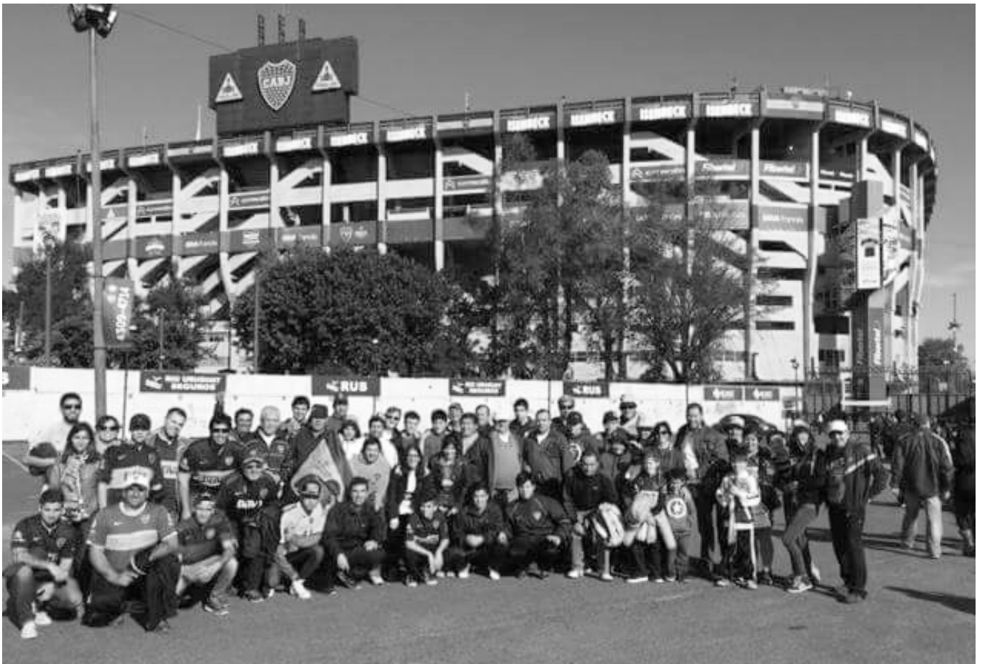
Nuestra delegación. Detrás, la Bombonera, que se ha convertido en una atracción internacional.

Los viajeros vivieron de este modo una experiencia muy valorada por ellos, que volvieron satisfechos por conocer la cancha «bostera». ■