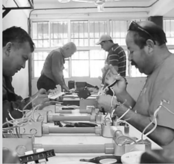
El curso tendrá una duración total de 30 horas.