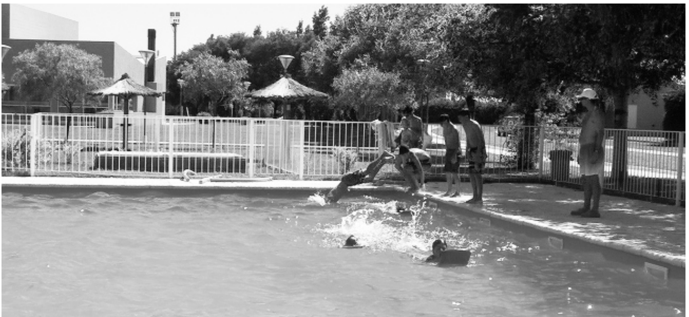
Los hijos y nietos de afiliados asisten a la Colonia de lunes a viernes, en el horario de 9:00 a 12:00.

Los días viernes y sábados podrán permanecer en el predio hasta las 03:00 del día siguiente y los domingos de 10:00 a 24:00. ■