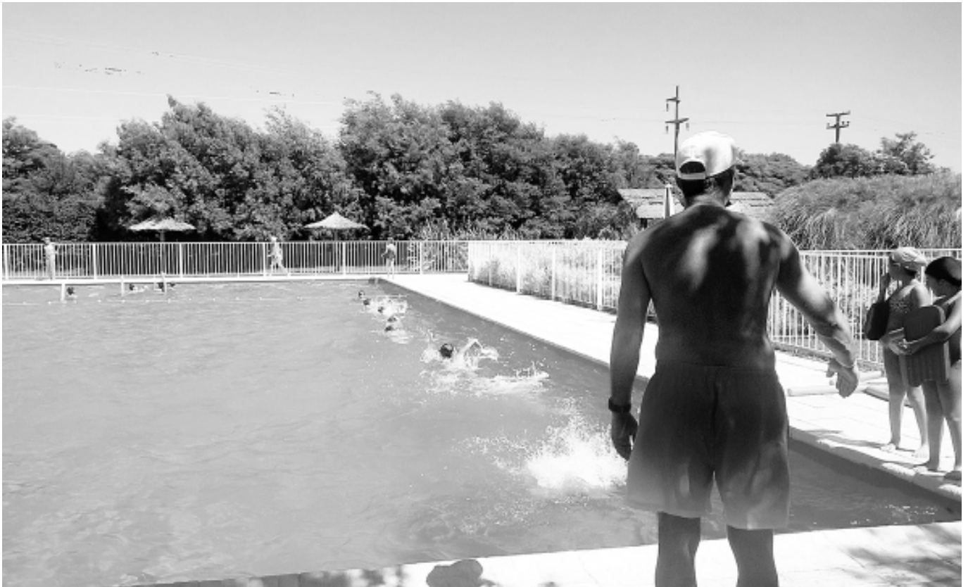
Uno de los profesores a cargo de los niños da instrucciones a un grupo de precoces nadadores.

CON UNA IMPORTANTE ASISTENCIA DE HIJOS Y NIETOS DE AFILIADOS, CONTINÚA DESARROLLÁNDOSE EN NUESTRO COMPLEJO POLIDEPORTIVO «CRO. SERGIO R. TRABUCCO» LA COLONIA DE VACACIONES, QUE ESTE AÑO CUENTA CON UN TOTAL DE 52 NIÑOS INSCRIPTOS.