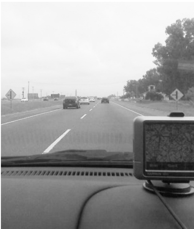
Respetemos las distancias recomendadas entre vehículos.