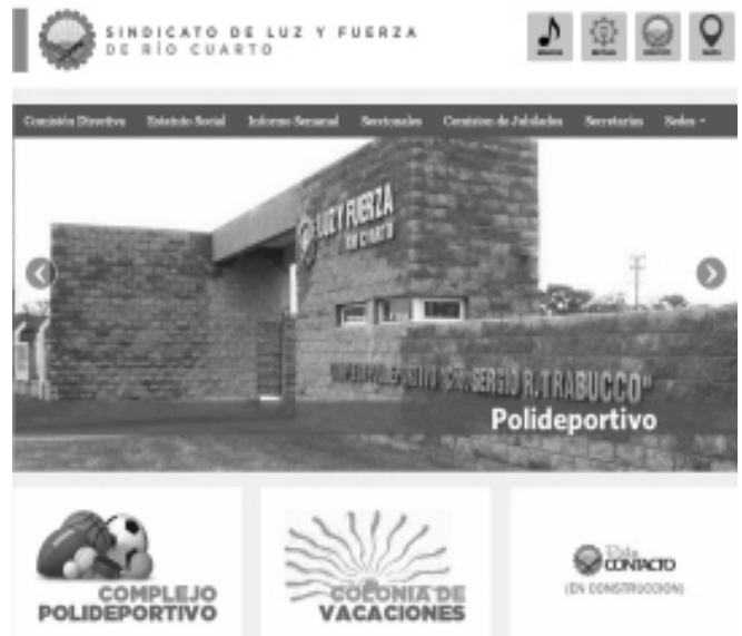
Portada del nuevo sitio www.luzyfuerzariocuarto.org

Las personas que ingresan al sitio tienen acceso a información sobre la Comisión Directiva, el Estatuto Social, las ediciones del Informe Semanal, seccionales, Comisión de Jubilados, secretarías, sedes, Mutual Alumbrar, OSFATLYF, Complejo Polideportivo «Cro. Sergio R. Trabucco», Colonia de Vacaciones de Villa del Dique y los últimos eventos organizados. Además se habilitó la descarga de documentos, como el Estatuto Social, el Informe Semanal, entre otros. Este es un nuevo servicio que pone en marcha la conducción de la organización sindical, en beneficio de todos los afiliados. ■