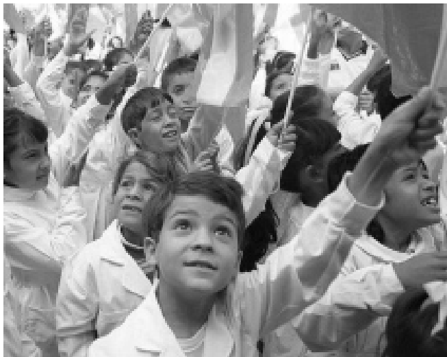
La contribución es válida para chicos de escuelas primarias.

■ EL SINDICATO DE LUZ Y FUERZA DE RÍO CUARTO HA DISPUESTO LA ENTREGA DE UNA CONTRIBUCIÓN ESCOLAR PARA HIJOS DE AFILIADOS EN EDAD ESCOLAR PRIMARIA.