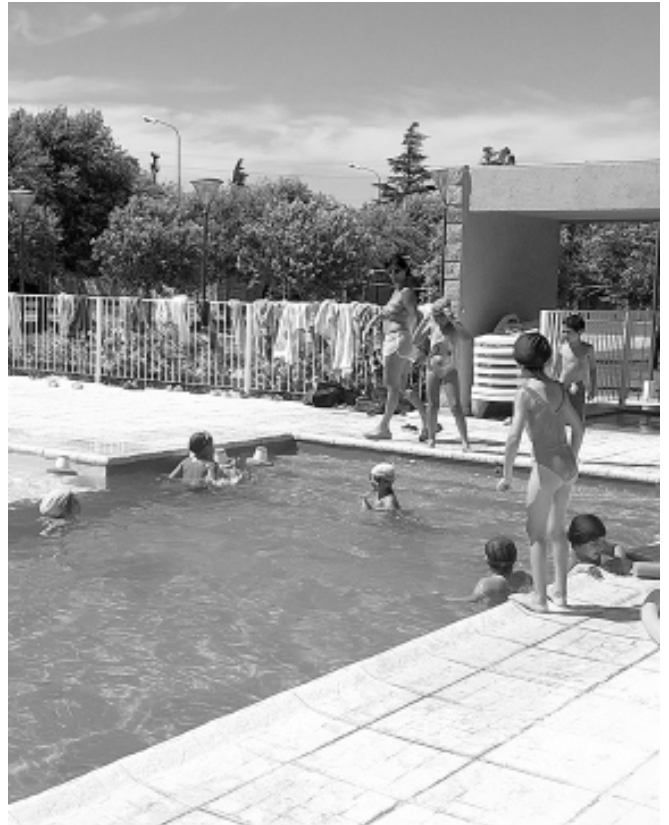
Una de las clases de natación para los más pequeños.

Por último recordamos que las actividades de cierre de la Colonia tendrán lugar en el predio del Complejo Polideportivo, el próximo viernes 19 del corriente mes de febrero. ■