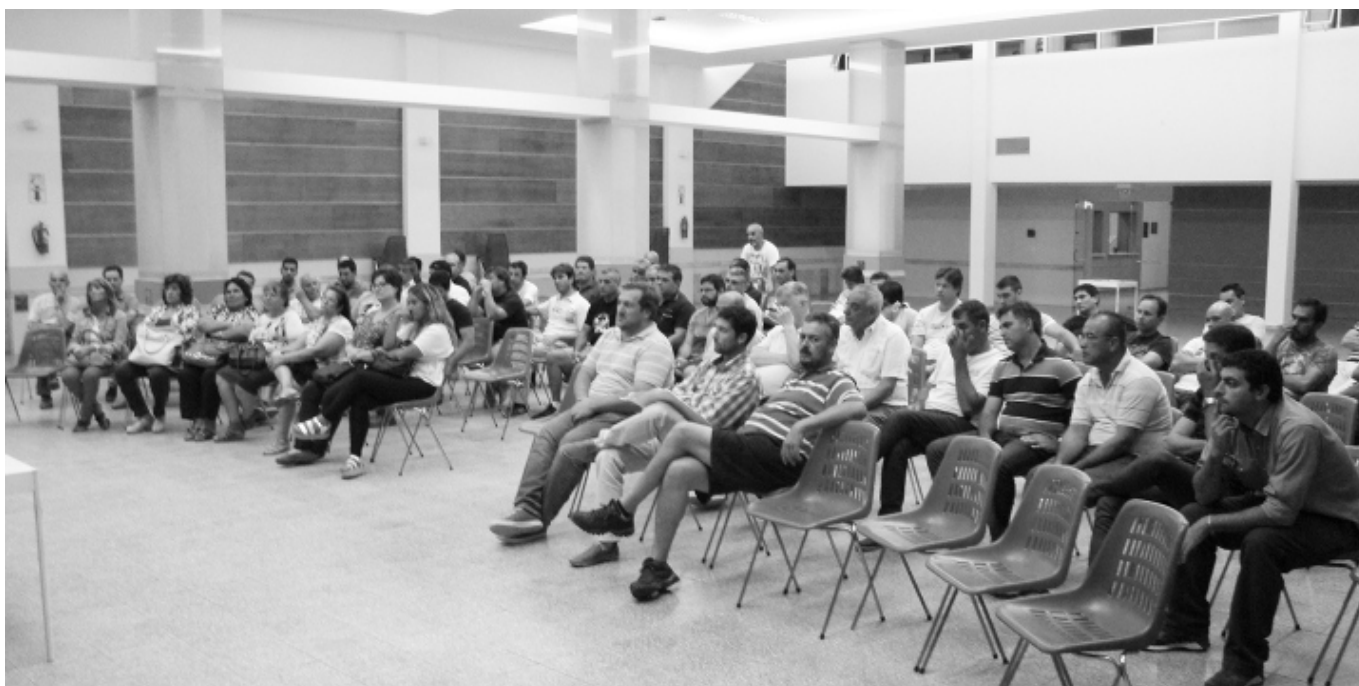
Los presentes aprobaron por unanimidad y con aplausos la adquisición del predio para construir viviendas.

Los afiliados por su parte podrán gestionar créditos para la construcción, como el PROCREAR -si este plan continúa, según lo ratificó el Presidente de la Nación en su reciente visita a Córdoba- o alguna línea crediticia ofrecida por la Provincia. «Lo importante es que cada uno ya podrá disponer de un terreno propio y a partir de allí podrá tener más cerca el cumplimiento del sueño de la vivienda propia», concluyó. ■