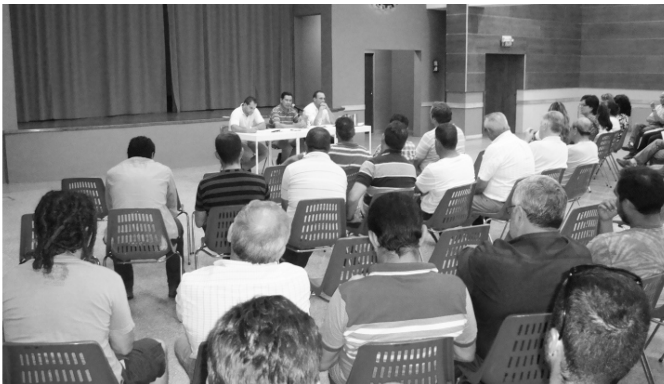
Una gran cantidad de afiliados concurrió a la Asamblea, a pesar de la época del año en que se llevó a cabo.

«A un año y diez meses de gestión tenemos la satisfacción de haber logrado uno de los objetivos que nuestra conducción se había propuesto, que era adquirir un lote que nos permitiera fraccionarlo y poder entregárselo a cada uno de los compañeros que están necesitando su vivienda propia», destacó el Secretario General.