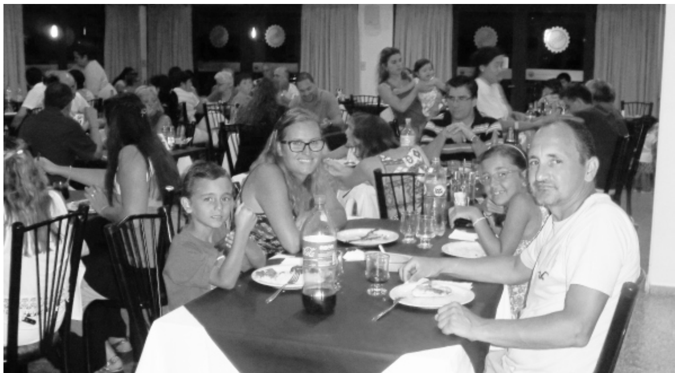
El comedor repleto de comensales, una constante de esta temporada.