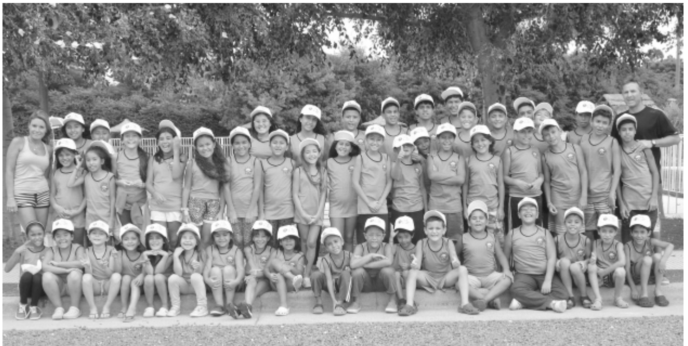
Asistentes a la Colonia de Verano edición 2016.