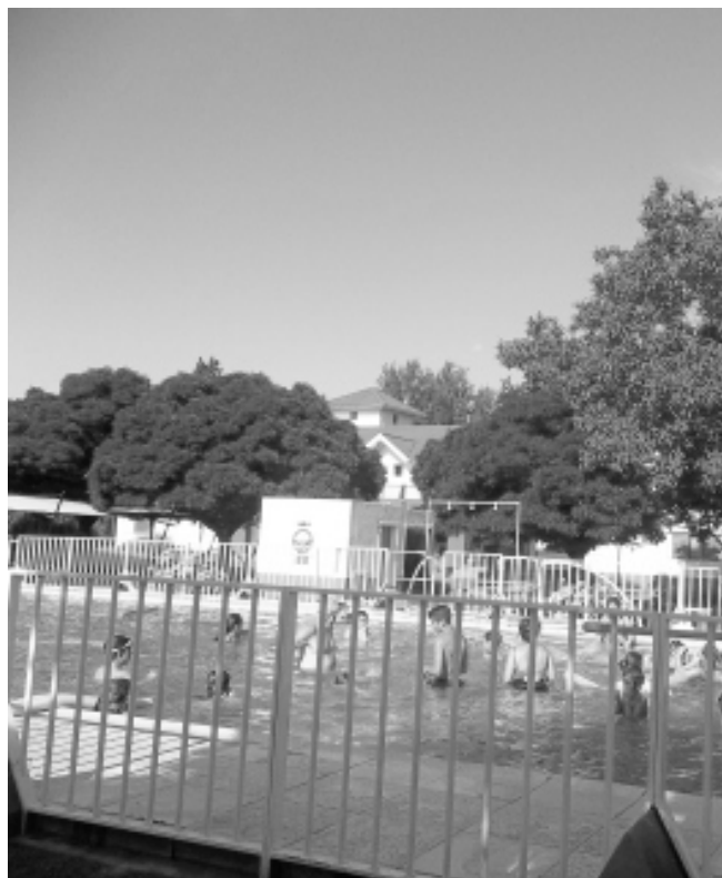
La pileta es la principal atracción para calmar el calor.

Los huéspedes pueden disfrutar de la pileta de natación, juegos y caminatas en cercanías del predio, además de trasladarse por otras localidades del Valle de Calamuchita manteniendo como base a la Colonia, para regresar a la hora de cada comida y en busca del descanso reparador. Al día siguiente continúan las actividades al aire libre que hacen de este un lugar singular en el corazón de las sierras de Córdoba. ■