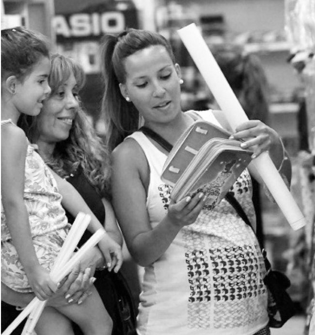
Los bonos contribuyen a la economía familiar.

■ COMO YA ES HABITUAL, ESTE SINDICATO SUSCRIBIÓ CONVENIOS CON DISTINTOS COMERCIOS DE RÍO CUARTO, CON EL PROPÓSITO DE BRINDAR A SUS AFILIADOS LA FACILIDAD DE ADQUIRIR ARTÍCULOS ESCOLARES MEDIANTE UN SISTEMA DE BONOS QUE CONTEMPLAN LA FINANCIACIÓN DE LA COMPRA.