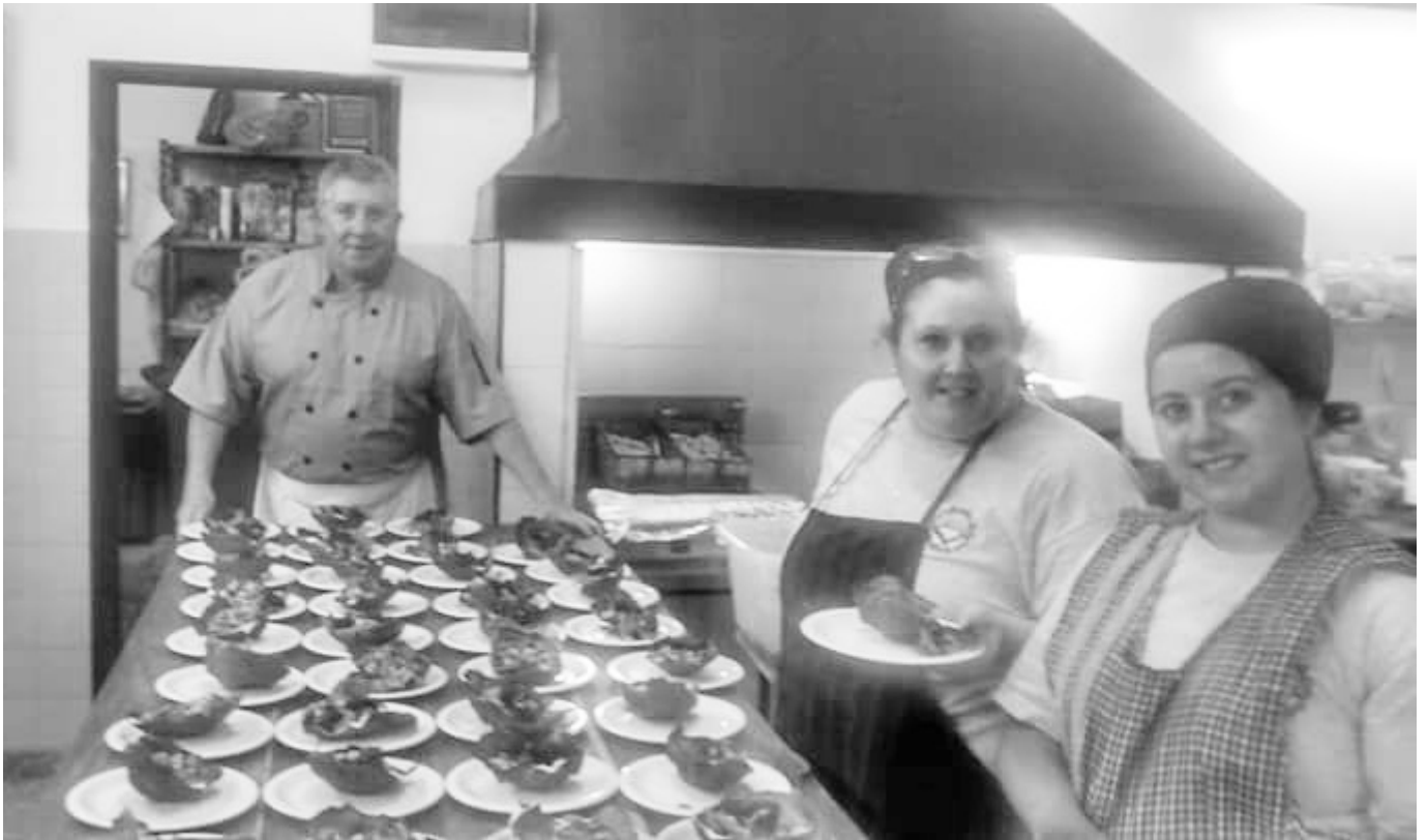
El cocinero exhibe uno de sus platos junto a sus colaboradoras, antes de ser servido a los comensales.