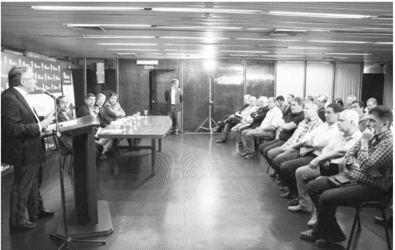
Instante del acto realizado en la sede de EPEC el jueves 4 del corriente.