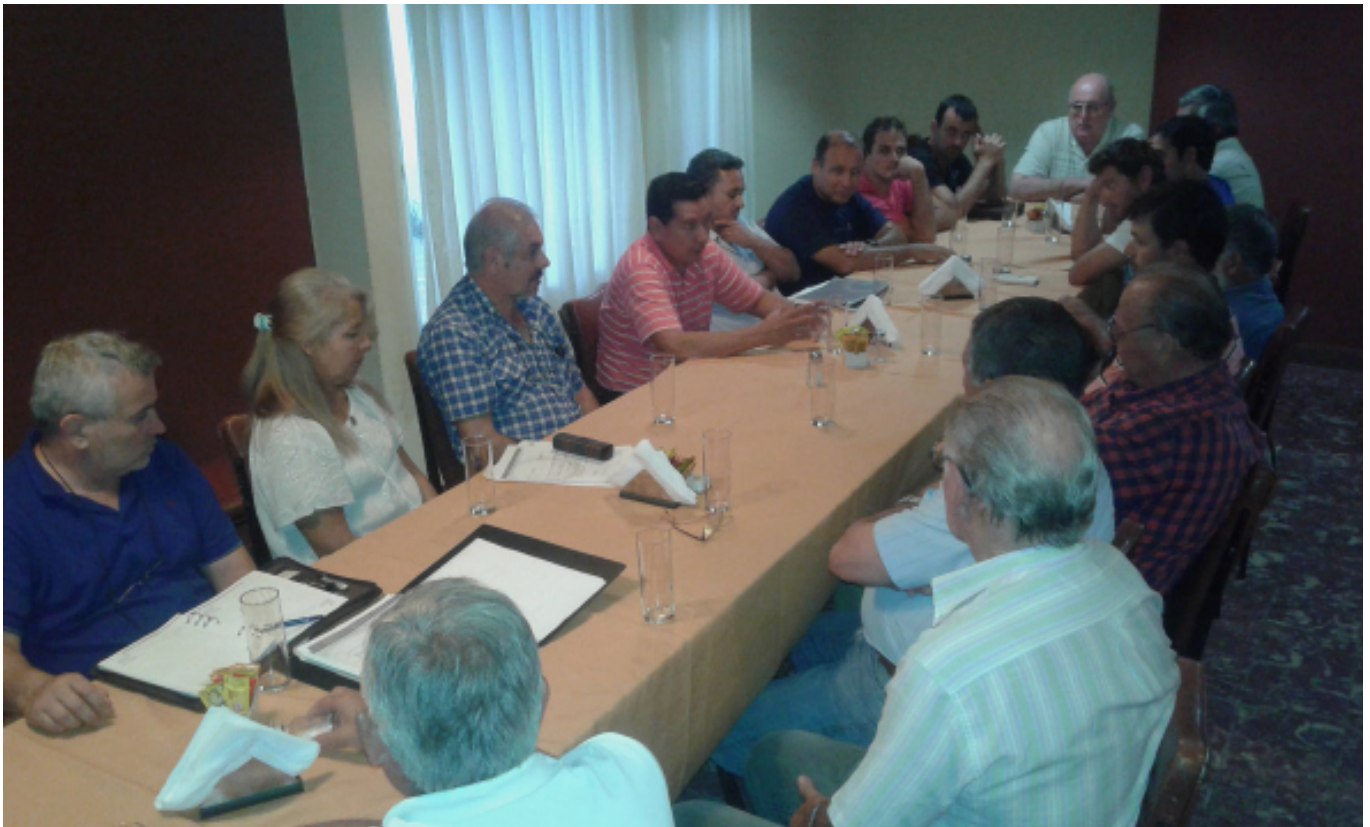
En el encuentro se abordaron diversos temas de interés para los compañeros activos y jubilados.