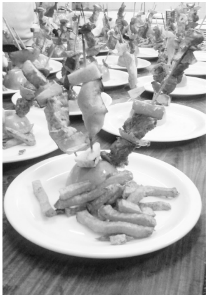
El postre helado y un plato innovador: brochettes de carnes variadas.