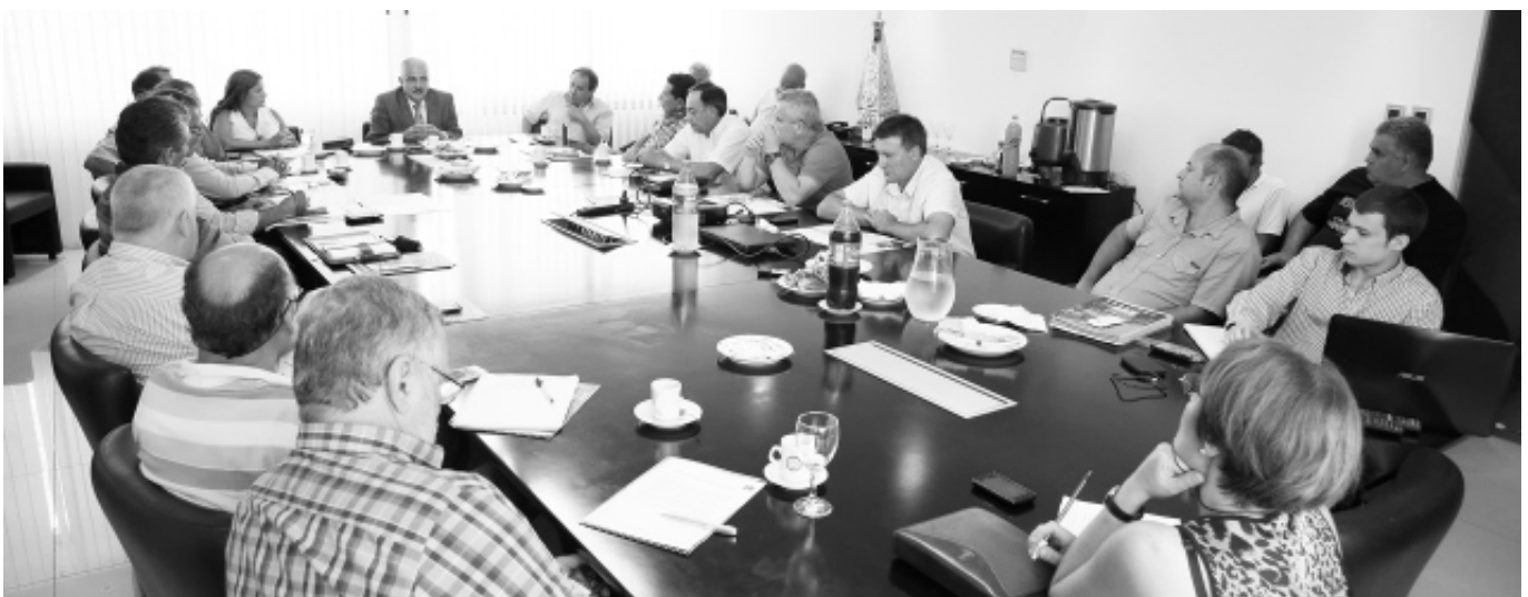
Momento de la reunión que se llevó a cabo en la ciudad de Córdoba.

Además Chávez ofreció la sede central del Sindicato de Luz y Fuerza de Río Cuarto para que sea anfitriona de la próxima reunión de la Comisión Cuatripartita de Higiene y Seguridad. ■