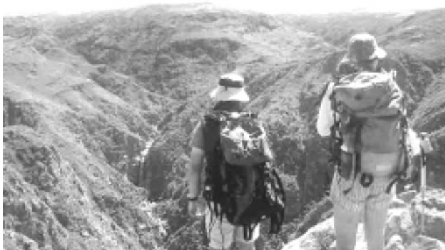
Quebrada de Yatán.

La organización corre por cuenta de la empresa Alto Rumbo (CSE), inscripta en el Registro Provincial de Prestadores de Servicios de Turismo Alternativo,