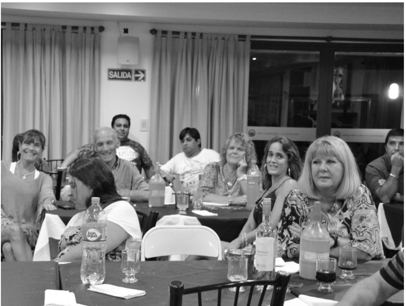
El comedor de la Colonia a pleno. Fue una constante en esta temporada.

En próxima entrega del Informe Semanal daremos mayor información al respecto. ■