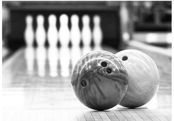
Las prácticas de bowling son en el London Rock.

Por otra parte, el día 5 del corriente comenzaron las correspondientes a paddle en el complejo Week-End ubicado en Banda Norte, repitiéndose todos los viernes a partir de las 18:00 y sábados desde las 10:00, en tanto que también arrancaron las prácticas de bowling en el London Rock & Bowling, de San Martín 947, las cuales continúan los viernes a partir de las 21:00. Los interesados en sumarse podrán contactarse con