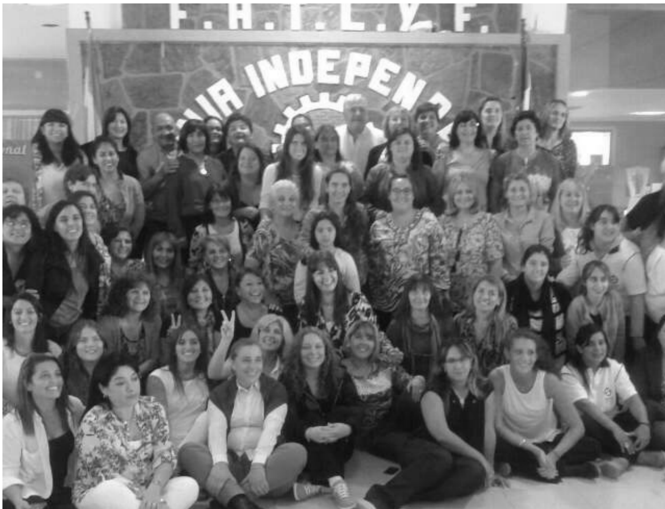
Asistentes al Primer Encuentro Nacional de Mujeres Lucifueristas.

encuentro se concrete en la Colonia de Vacaciones de Villa del Dique. En parte del desarrollo del encuentro, y en el cierre, cerca del 40 por ciento de la conducción