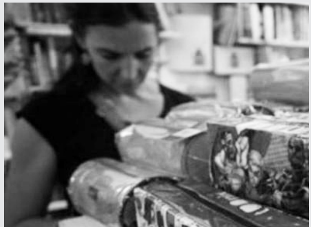
Los bonos contribuyen a la economía familiar.

Para las seccionales, los afiliados que por razones de distancia no puedan concurrir personalmente a efectuar las compras de los textos escolares deberán hacer su pedido a través del Secretario de Seccional, siendo éste el responsable de comunicarse con la Secretaría de Administración y Finanzas (preferentemente por correo electrónico a la cuenta de la Secretaría: administración@luzyfuerzariocuarto.org ), consignando nombre y apellido de los afiliados que lo soliciten. Además se deberá indicar título, autor, editorial y nivel escolar de los libros requeridos.