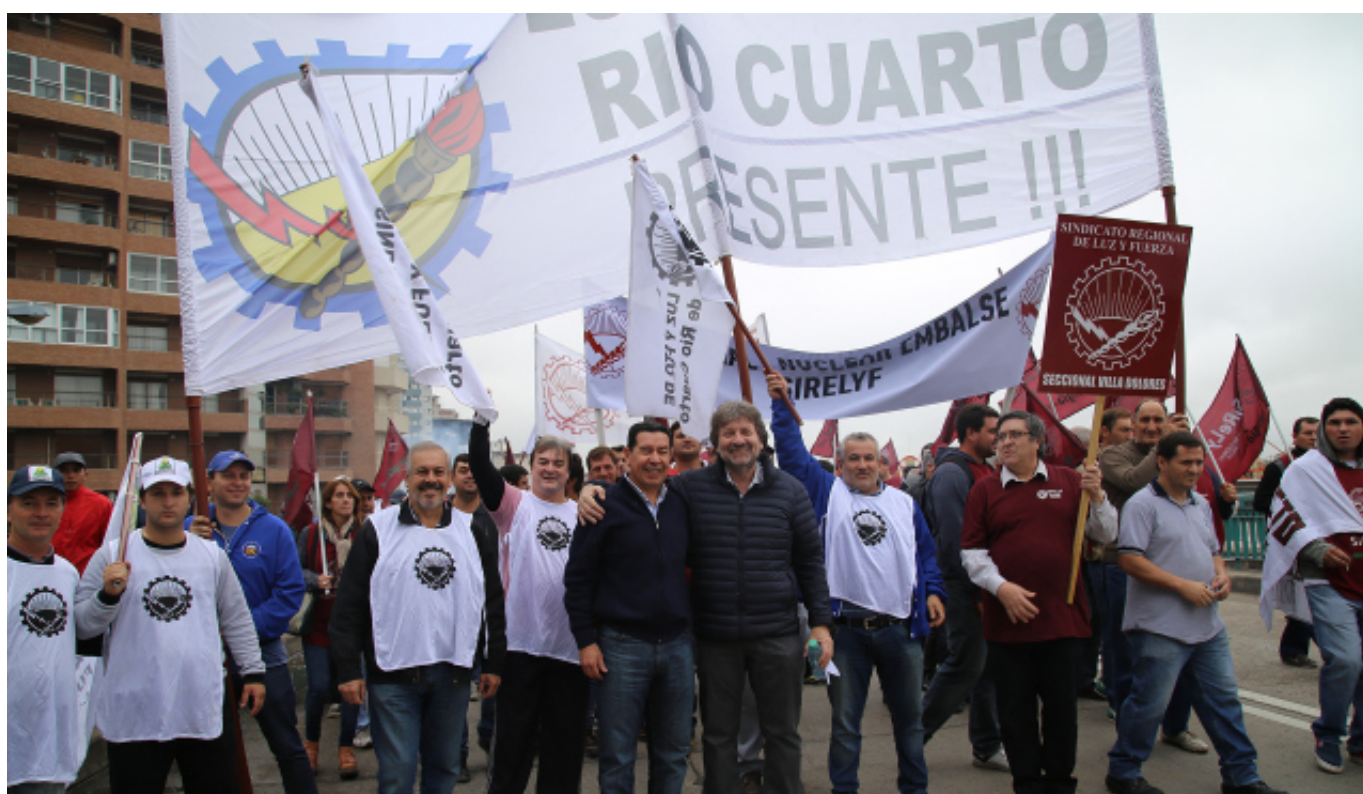
Compañeros de los sindicatos lucifuercistas Regional y Río Cuarto, manifestándose por las calles de Córdoba.