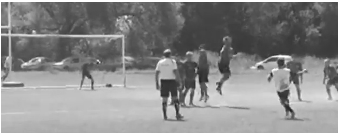
Momento del partido jugado en la cuarta fecha en la que Luz y Fuerza derrotó a Fénix por 2 a 1.