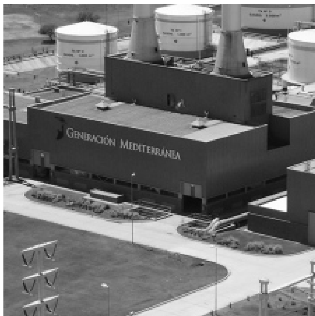
Central Maranzana, de Río Cuarto.

El estado de alerta llega “luego de innumerables reclamos de toda índole, y ante la demora en las respuestas del mencionado Grupo, en cuanto a la negociación de paritarias y la unificación de la aplicación del Convenio Colectivo de Trabajo 36/75, dentro del ámbito de actuación de vuestro Grupo”, señala la Federación en la mencionada comunicación. ■