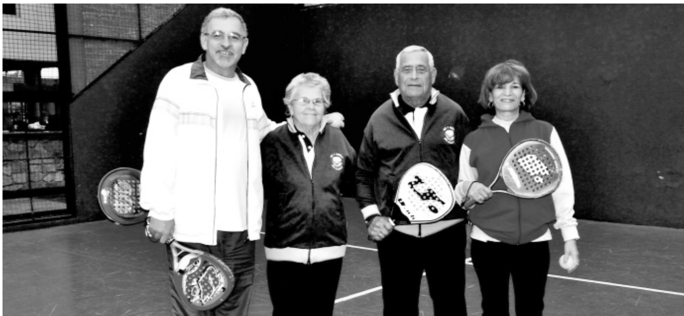
Una imagen de la anterior edición del Encuentro Nacional de Jubilados.

■ LA COMISIÓN DE JUBILADOS Y PENSIONADOS DEL SINDICATO DE LUZ Y FUERZA DE RÍO CUARTO INVITA PARA EL 23 DE ABRIL A PARTICIPAR DE LA PRESELECCIÓN PARA CONCURRIR AL XX ENCUENTRO NACIONAL, SOCIAL, CULTURAL Y DEPORTIVO, QUE SE REALIZARÁ EN TERMAS DE RÍO HONDO EN FECHA A CONFIRMAR.