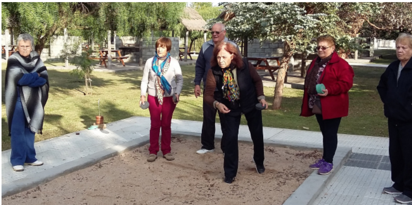
El tejo chino, una de las disciplinas que acapará el interés de los participantes en la jornada de preselección.

■ APROVECHANDO LA TIBIA TARDE DE SOL QUE CONTRASTÓ CON TANTOS DÍAS NUBLADOS, ALREDEDOR DE 30 COMPAÑEROS JUBILADOS Y PENSIONADOS CONCURRIERON EL SÁBADO 28 DE MAYO A LA MATEADA QUE ORGANIZÓ LA COMISIÓN DE JUBILADOS Y PENSIONADOS DE NUESTRA ORGANIZACIÓN SINDICAL EN EL COMPLEJO POLIDEPORTIVO "CRO. SERGIO R. TRABUCCO".