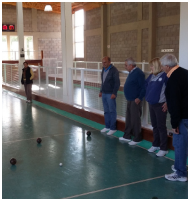
Compañeros siguen atentamente el avance de una bocha.

La próxima reunión se llevará a cabo en el mes de agosto, luego de las actividades programadas por el Día del Trabajador de la Electricidad. Una vez que sea fijada la fecha, se comunicará a través de este Informe Semanal.