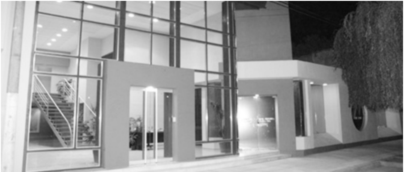
Fachada de la Cooperativa de Energía Eléctrica de Las Varillas.

■ LA CONDUCCIÓN DEL SINDICATO DE LUZ Y FUERZA DE RÍO CUARTO SE ENCUENTRA EVALUANDO LA APLICACIÓN DE UN EVENTUAL PLAN DE LUCHA, COMO PARTE DE LAS GESTIONES QUE VIENE REALIZANDO PARA LOGRAR LA REINCORPORACIÓN DE DOS COMPAÑERAS DE LA SECCIONAL LAS VARILLAS QUE FUERON INJUSTAMENTE SEPARADAS DE SUS FUNCIONES.