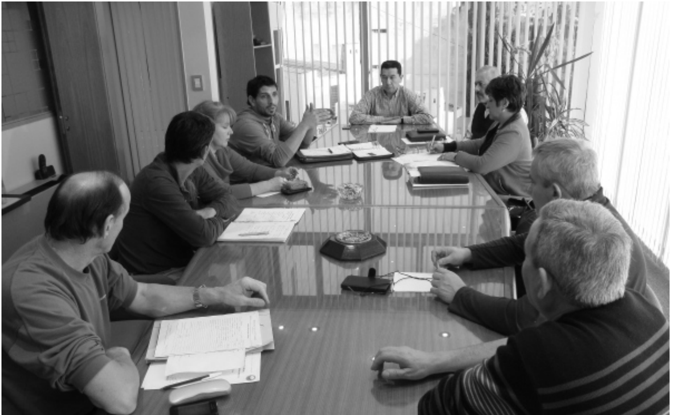
Instante de la reunión de Comisión Directiva efectuada el jueves pasado.