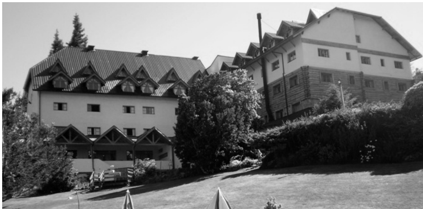
Fachada del Hotel «Amancay», de San Carlos de Bariloche.