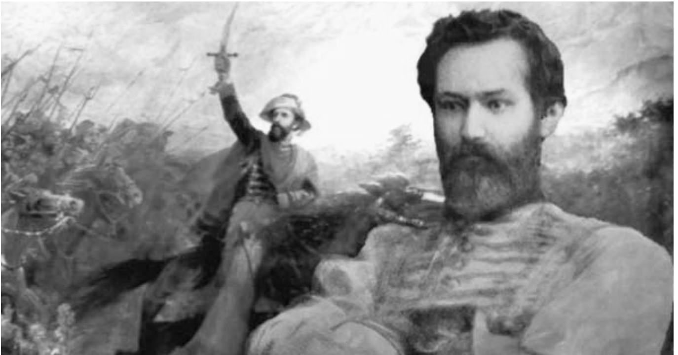
El feriado del 17 de junio recordaría la muerte de Martín Miguel de Güemes, quien fuera una pieza clave en las luchas patrias.

a desarmar a su provincia. El conflicto llegó a oídos del Director Supremo Álvarez Thomas quien decidió enviar una expedición al mando del coronel Domingo French para mediar en el conflicto y socorrer a las tropas de Rondeau varadas en el norte salteño. Rondeau parecía más preocupado por escarmentar a Güemes y evitar el surgimiento de un nuevo Artigas en el Norte que por aunar fuerzas y preparar la resistencia frente al inminente avance español. Finalmente, el 22 de marzo de 1816 se llegó a un acuerdo: Salta seguiría con sus métodos de guerra gaucha bajo la conducción de Güemes y brindaría auxilio a las tropas enviadas desde Buenos Aires.