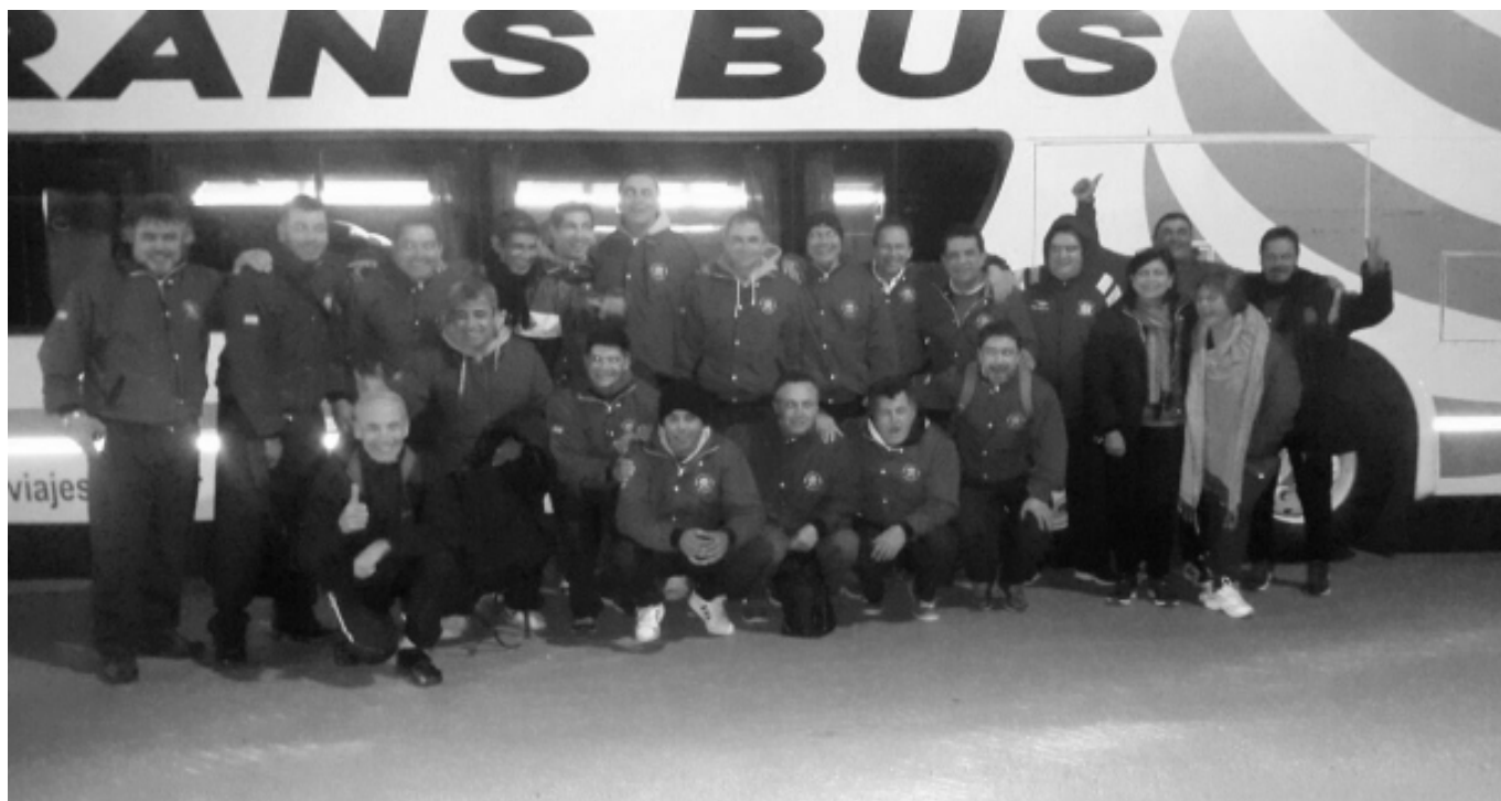
Nuestra delegación, momentos antes de partir hacia la ciudad de Mar del Plata.

AL CIERRE DE ESTA EDICIÓN LOS EQUIPOS QUE REPRESENTAN A NUESTRA ORGANIZACIÓN SINDICAL EN EL CAMPEONATO ARGENTINO "OSCAR SMITH" SE ENCONTRABAN JUGANDO LOS ÚLTIMOS PARTIDOS EN LA CIUDAD DE MAR DEL PLATA, POR LO CUAL EN LA PRÓXIMA SEMANA PODREMOS COMENTAR LOS RESULTADOS OBTENIDOS.