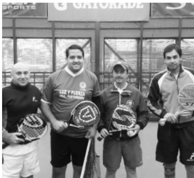
El equipo de paddle, al enfrentar a General Pueyrredón.

Los integrantes de cada equipo fueron seleccionados en torneos internos que se realizaron con anterioridad, como se informó oportunamente.