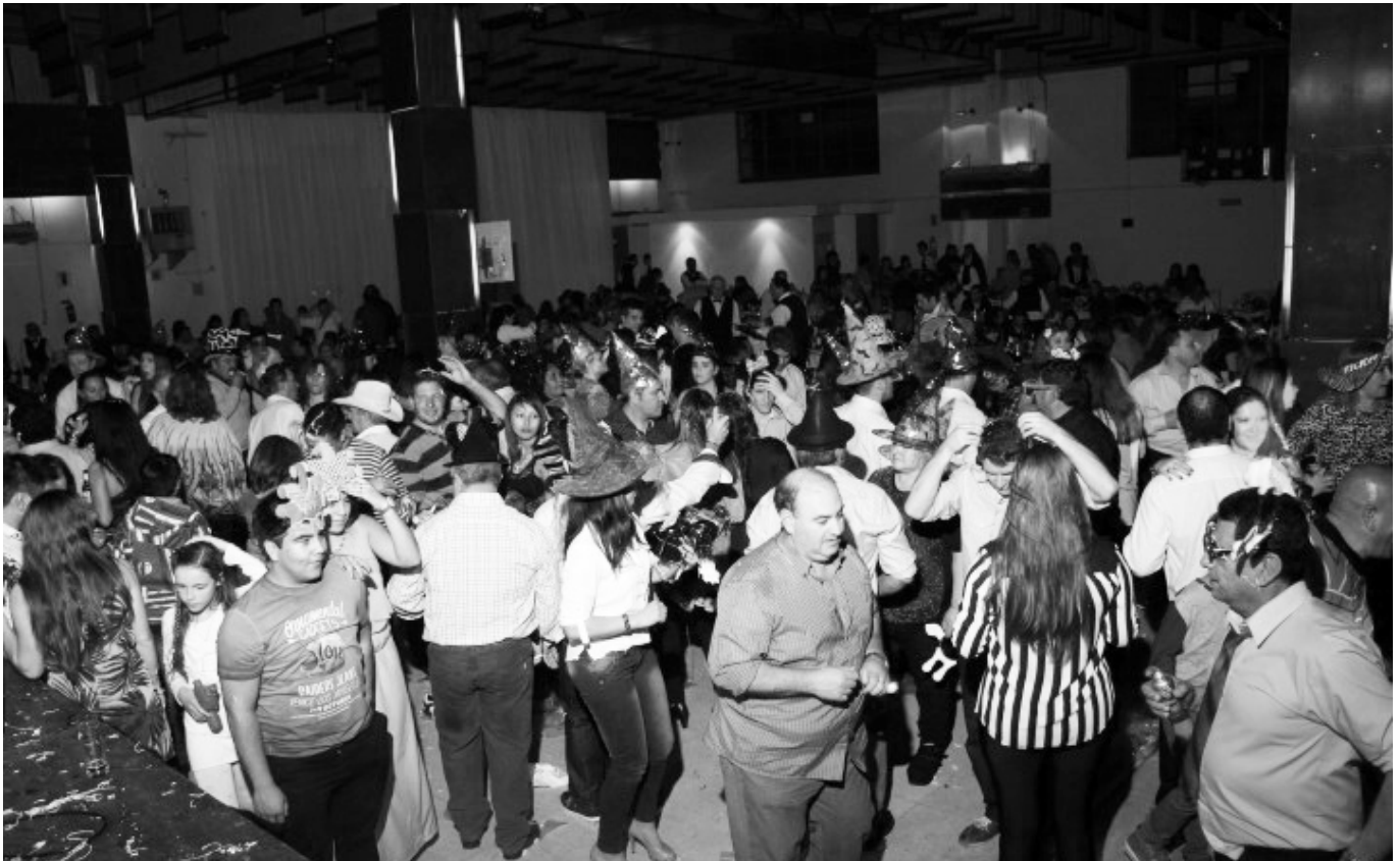
Numerosos afiliados de Río Cuarto y las seccionales seguramente se sumarán a la alegría del festejo lucifuercista.