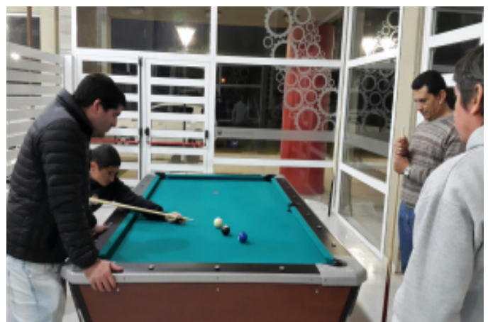
Ganadores en truco (izquierda), un instante del torneo de pool (derecha) y el almuerzo de camaradería posterior (arriba).

EN EL MARCO DE LAS ACTIVIDADES PREVISTAS PARA FESTEJAR EL DÍA DEL TRABAJADOR DE LA ELECTRICIDAD, EL SÁBADO 11 DEL CORRIENTE NUMEROSOS AFILIADOS PARTICIPARON DE LOS TORNEOS DE TRUCO, CHIN-CHÓN Y POOL EN LAS INSTALACIONES DE NUESTRO COMPLEJO POLIDEPORTIVO "CRO. SERGIO R. TRABUCCO".