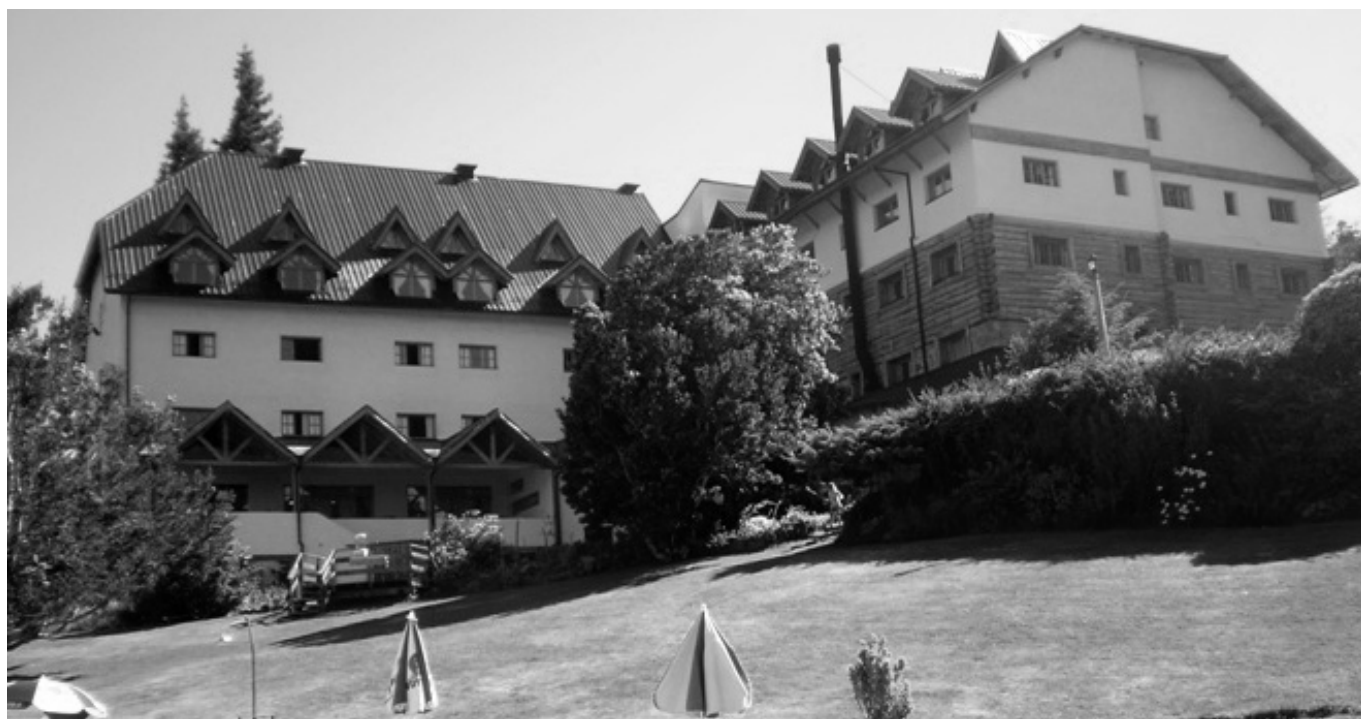
Fachada del Hotel «Amancay», de San Carlos de Bariloche.