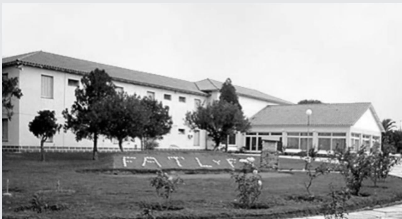
Hotel «Independencia» - Termas de Río Hondo.